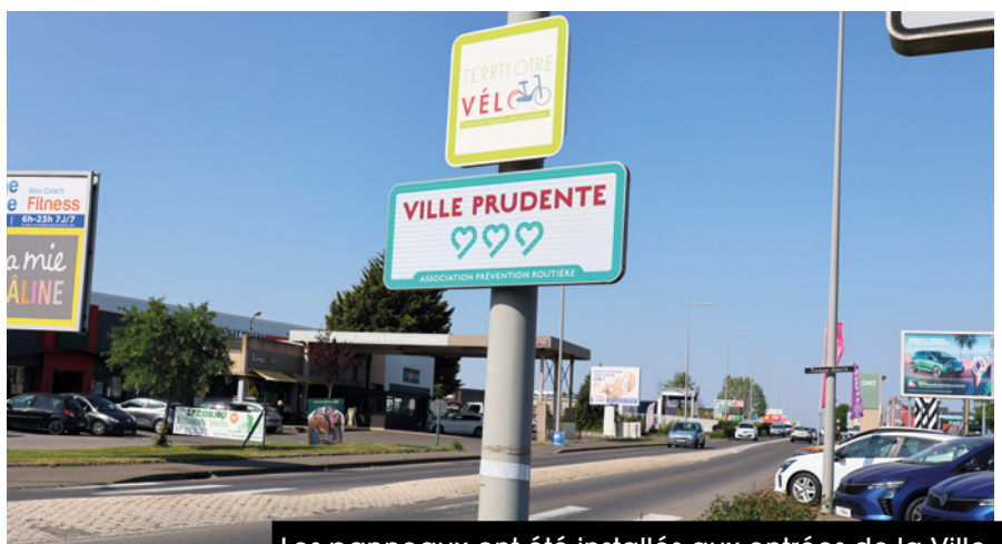
Les panneaux ont été installés aux entrées de la Ville.

La Ville de Flers mène depuis plusieurs années une politique volontariste en matière de sécurité routière et piétonne. Parmi ses nombreuses mesures prises,