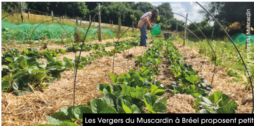
Les Vergers du Muscardin à Bréel proposent petits fruits, fruits du verger et aromates.

Des restes de cuisine ? Trop de plastique dans vos sacs jaunes ? Et si