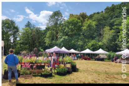
Deux marchés ont lieu à Bréel et La Roche d'Oëtre.