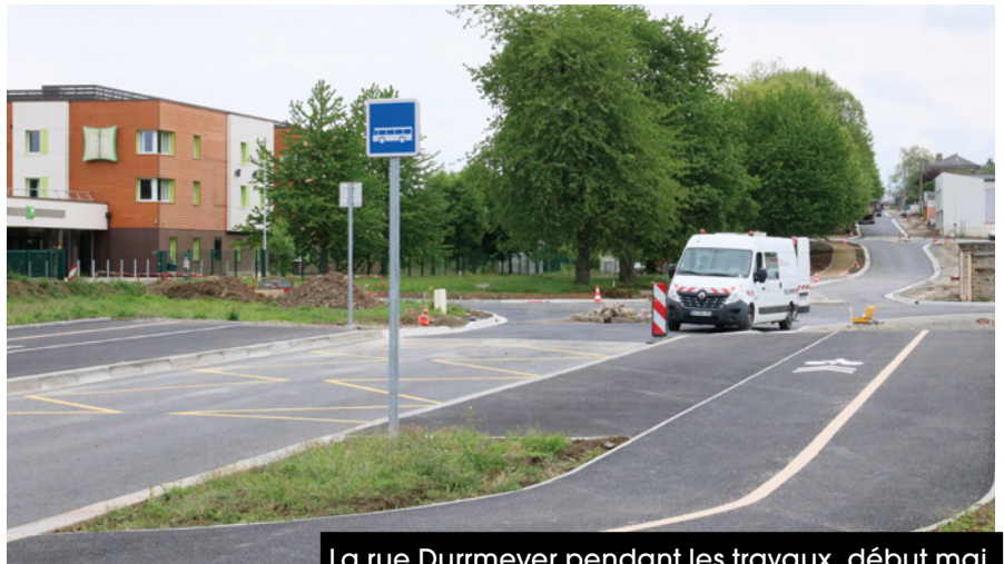
La rue Durrmeyer pendant les travaux, début mai.

La chaussée a été entièrement refaite ainsi que les trottoirs. Deux pistes