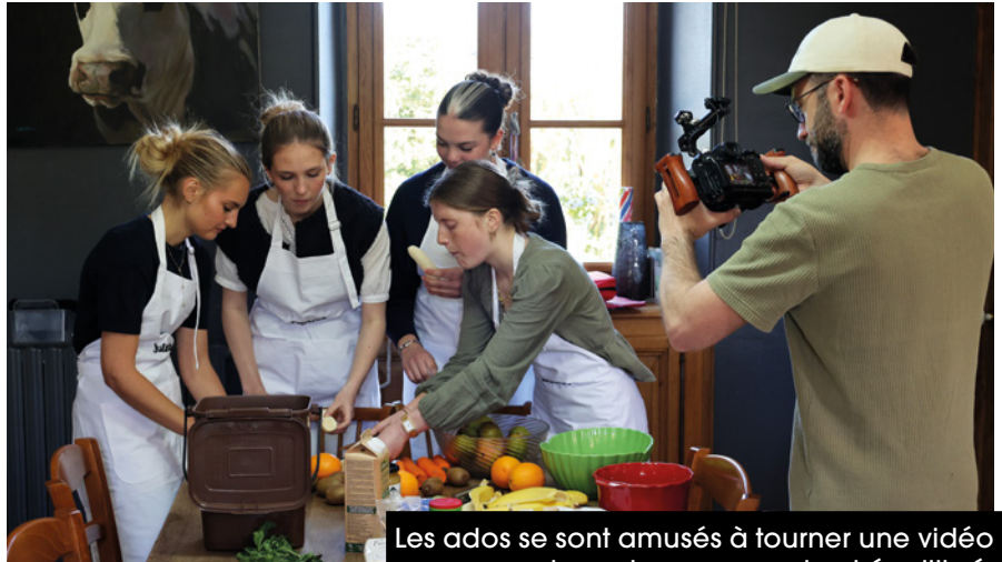
Les ados se sont amusés à tourner une vidéo pour partager leur menu sain et équilibré.

Avec l'aide d'une nutritionniste, ils ont réfléchi à un menu sain et équilibré : un burger végétarien élaboré à base de produits locaux, qu'ils ont cuisiné