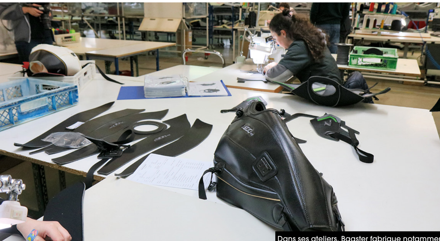
Dans ses ateliers, Bagster fabrique notamment des protège-réservoirs et des selles de motos.