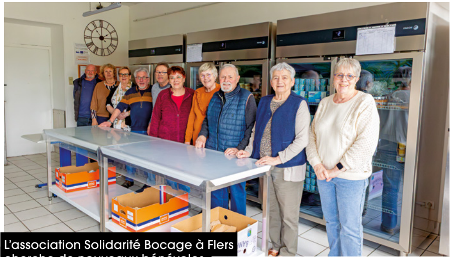
L'association Solidarité Bocage à Flers cherche de nouveaux bénévoles.

Pour nourrir les familles dans le besoin, l'association collecte quotidiennement des dons auprès de partenaires locaux (supermarchés, boulangeries, entreprises agroalimentaires, producteurs, Banque alimentaire de l'Orne...). Ses bénévoles organisent également