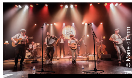
Le groupe The Celtic Tramps se produira le 17 juillet.

Le 21 août , c'est de la chanson festive qui attend le public, à 21 heures, avec le groupe Joyeux Bordel.