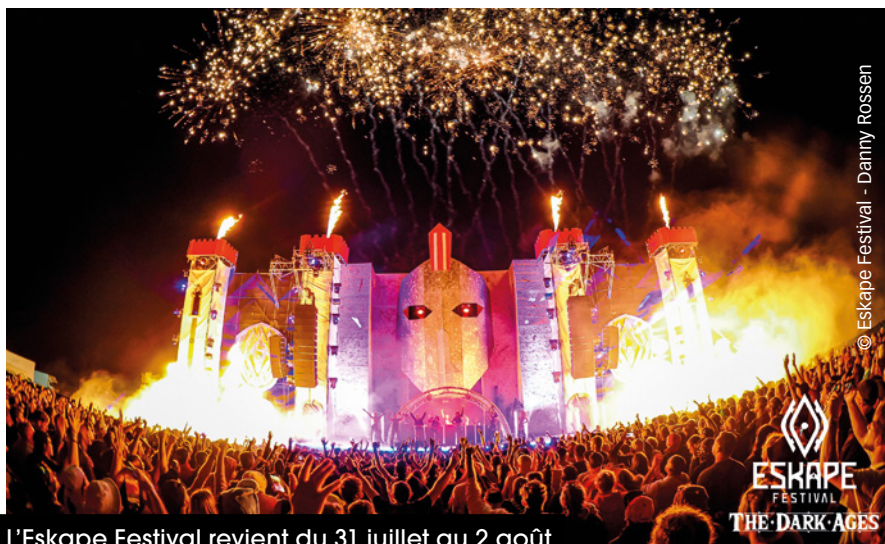
L'Eskape Festival revient du 31 juillet au 2 août.

Ça va swinguer à Briouze les 24 et 25 juillet ! Le festival Art Sonic