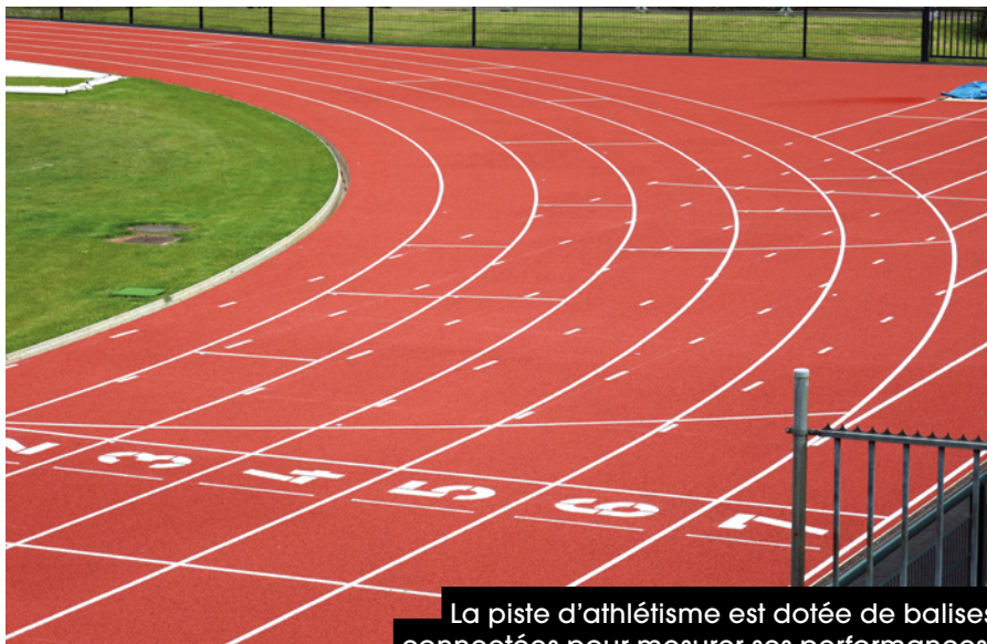
La piste d'athlétisme est dotée de balises connectées pour mesurer ses performances.

Parallèlement, le terrain d'honneur de football a été retravaillé pour favoriser une meilleure infiltration de l'eau de