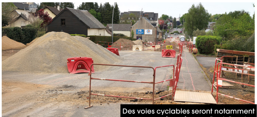
Des voies cyclables seront notamment aménagées rue Paul-Garnier.

De chaque côté de la rue, des trottoirs, des voies cyclables et des stationnements en pavés enherbés vont être créés. La nouvelle zone d'activités