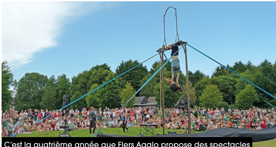
C'est la quatrième année que Flers Agglo propose des spectacles dans les communes, dans le cadre des Rendez-vous de l'été.

Athis-de-l'Orne , commune déléguée d'Athis-Val-de-Rouvre, accueillera le spectacle Les Moyens du bord de la Cie Carnage Productions, le 18 juillet. La représentation aura lieu place de la mairie.