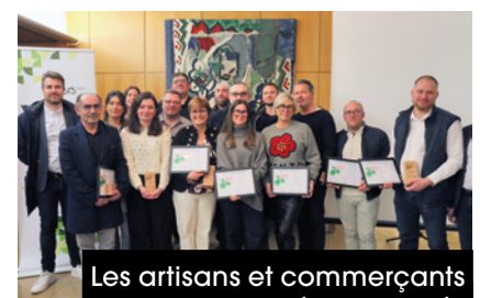
Les artisans et commerçants récompensés

salon de coiffure Lainé Fabienne, à Athis-Val-de-Rouvre, le fleuriste Écllosion by Chloé et l'institut de beauté Esth'&Zen, à Briouze, l'entreprise spécialisée dans l'isolation écologique et la maçonnerie du bâti ancien Pi-cœuvre, à Caligny, le café-bar-épicerie Chez M&M, au Châtellier, le restaurant Rapid'Plat, l'institut de beauté Nature Zen, Ferté Fleurs Aline, la boulangerie Ameline, la Taverne de la Paix et le bar de la Plage, à La Ferté-Macé, Lemoy Traiteur, le bar le Saint-Georges, l'entreprise spécialiste des climatiseurs Climinox, BFO Automobiles et le magasin de producteurs la Halte Paysanne, à Saint-Georges-des-Groseillers, la quincaillerie Sétin, le restaurant le Cockpit, la Cave Saint-Vincent, la brasserie Saint-Germain, l'entreprise de location, vente et réparation de robots tondeuses