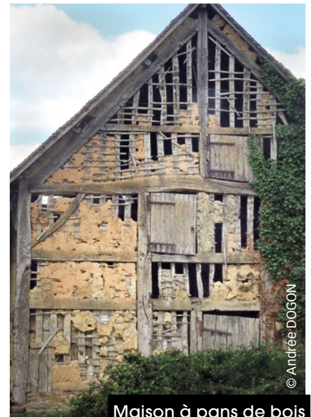
Maison à pans de bois à Bellou-en-Houlme

Et aviez-vous déjà entendu parler de nos saints guérisseurs locaux ? À La Lande-Patry, Saint-Armel protégerait des peurs des premiers pas et Sainte-Marguerite les femmes enceintes. Saint-Laurent serait invoqué en cas de brûlures ou de zonas. À Caligny, un culte est voué à Notre-Dame du chêne pour guérir les boiteux et aider les enfants ayant des difficultés à marcher. L'eczéma serait apaisé par Sainte-Radegonde à Flers à la chapelle Notre-Dame. Les maladies de peau seraient guéries à La Chapelle-Biche par Saint-Méen et à Landigou par Saint-Marcouf. Profitez de cet été pour aller découvrir ces curiosités de notre territoire !