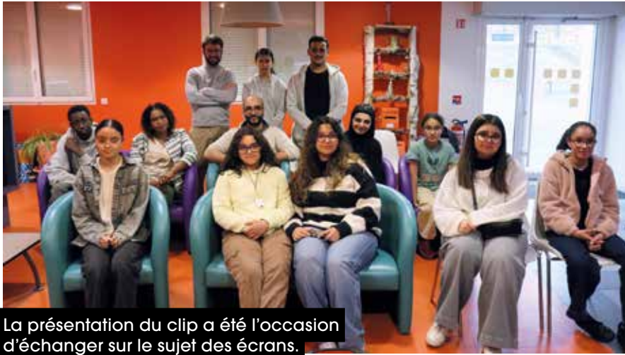
La présentation du clip a été l'occasion d'échanger sur le sujet des écrans.

aborde le thème de l'addiction aux écrans de façon générale.