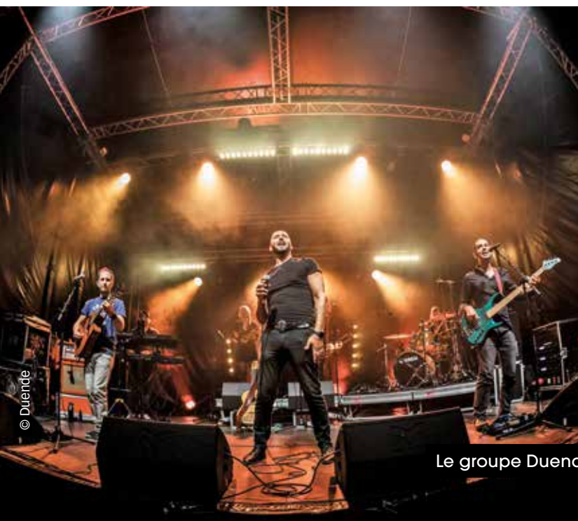
Le groupe Duende

Le 21 juin venez fêter la musique et l'arrivée de l'été à Flers ! La Ville, organisatrice de l'événement, propose deux concerts : le groupe de rock latino cuivré et festif Duende à partir de 20h, suivi du groupe de jazz hip-hop Sax Machine à partir de 22h.