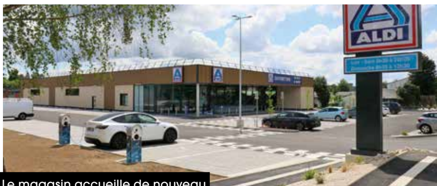
Le magasin accueille de nouveau les clients depuis le 14 mai.

Avec une surface de vente qui est passée de 744 à 1 000 m 2 pour environ 2 000 références, c'est plus de confort pour les clients et des conditions de travail améliorées pour l'équipe. Le bâtiment, réalisé en structure bois, est