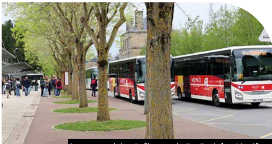
La gare scolaire de Flers centralise l'arrivée et le départ de nombreux élèves, collégiens et lycéens.

Flers Agglo organise 35 circuits scolaires sur l'ensemble de son territoire. Ceux-ci desservent les écoles primaires, les collèges et les lycées. Pour en bénéficier, il faut posséder un abonnement annuel Campus, réservé aux élèves de primaire, collégiens, lycéens et BTS domiciliés et scolarisés dans l'une des 42 communes de Flers Agglo.