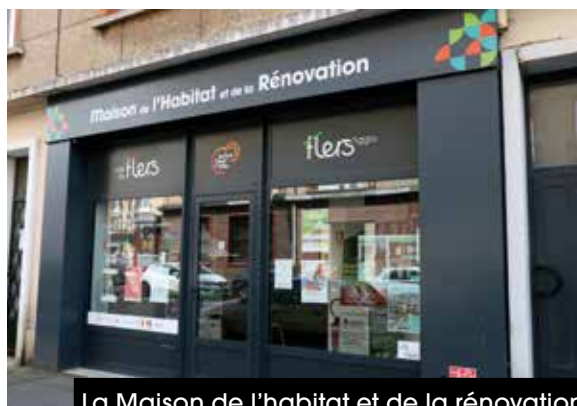
La Maison de l'habitat et de la rénovation ouvre ses portes samedi 14 juin.

Il sera également possible de rencontrer les professionnels d'Inhari pour obtenir des conseils gratuits et personnalisés pour tous les travaux de rénovation énergétique. Un atelier éco-geste sera proposé. Une question juridique sur le logement, les copropriétés ? Les juristes de l'Adil, l'Agence départementale d'information sur le logement, pourront répondre à toutes vos interrogations. Les architectes-conseillers du CAUE de l'Orne, le Conseil d'architecture, d'urbanisme et de l'environnement, seront également