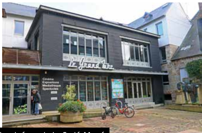
Le cinéma de La Ferté-Macé.

À La Ferté-Macé, le cinéma Gérard-Philippe est situé rue Saint-Denis. La structure est gérée par l'association CinéFerté. Toutes les séances, des films grand public aux films d'art et essai, et les animations sont annoncées sur le site Internet cineferte.fr .