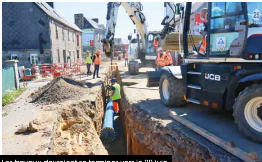
Les travaux devraient se terminer vers le 20 juin.

Flers Agglo, dans le cadre de l'entretien courant de son réseau, remplace 2 km de canalisations anciennes dont 1 km de canalisations d'eau potable qui alimentent les habitants de la commune et 1 km de canalisations