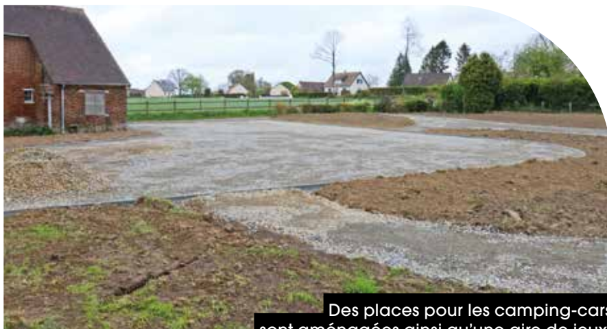
Des places pour les camping-cars sont aménagées ainsi qu'une aire de jeux.

Des places de stationnement pour les camping-cars sont notamment aménagées pour les usagers de la salle des fêtes. L'objectif étant de libérer de la place sur le parking actuel et éviter que les voitures se garent de l'autre côté de la route. « C'est plus de sécurité », souligne l' élu.