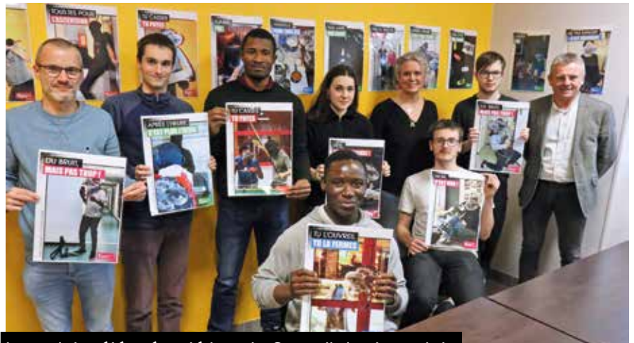
Le projet a été présenté lors du Conseil de vie sociale

qu'il soit observé ou non. Au total, 27 clichés ont été sélectionnés et affichés dans des endroits stratégiques de la résidence.