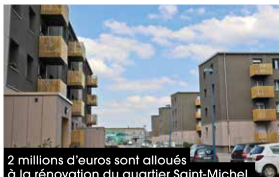
2 millions d'euros sont alloués à la rénovation du quartier Saint-Michel.

Le budget prévoit également des travaux d'aménagement de restaura-