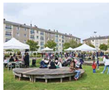
Les maisons d'activités organisent de nombreux événements.

À noter que la Caisse d'Allocations Familiales (Caf) participe aux projets d'animations des Maisons d'activités de Flers Agglo.