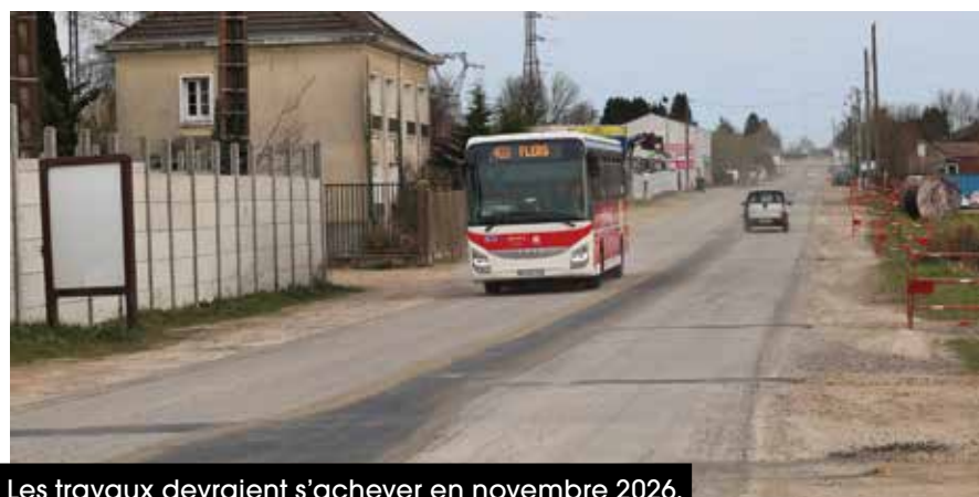
Les travaux devraient s'achever en novembre 2026.

La rue de la Géroudière à Flers, entre le rond-point du Pont-Féron et le lycée Jean-Guéhenno, sera refaite dans les mêmes délais.