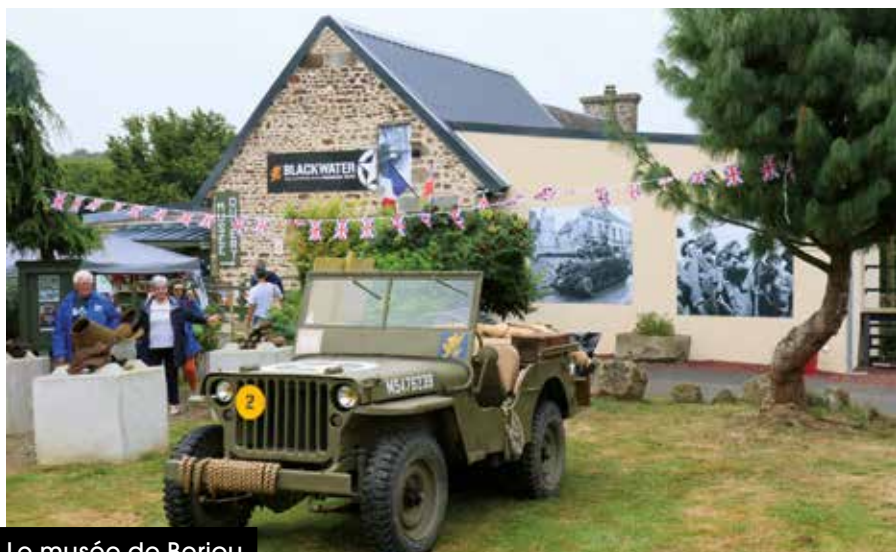
Le musée de Berjou.

Le territoire de Flers Agglo compte quatre musées : le musée du château de Flers, le Blackwater Museum 39/45 à Berjou et le musée du jouet de La Ferté-Macé, sans oublier la maison du Fer à Dompierre.