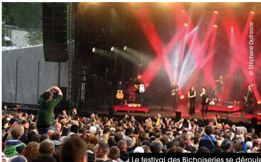
Le festival des Bichoiseries se déroule les 27 et 28 juin.

Deux jours de fiesta vous attendent à Briouze les 18 et 19 juillet au son de Clara Luciani, Gazo, Deluxe, Rilès, Ultra Vomit et tant d'autres... Labellisé Drastic on Plastic depuis 2022, le festival Art Sonic s'engage depuis de nombreuses années pour réduire