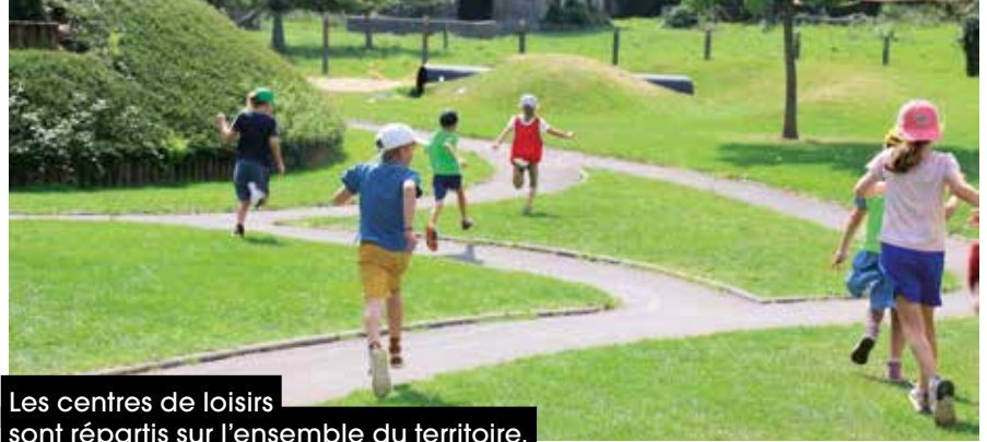
Les centres de loisirs sont répartis sur l'ensemble du territoire.

Ces structures, autonomes dans leur fonctionnement, sont déclarées auprès du Service départemental à la Jeunesse, à l'Engagement et aux Sports. Elles disposent d'un projet pédagogique et respectent un taux d'encadrement assuré par des animateurs diplômés.