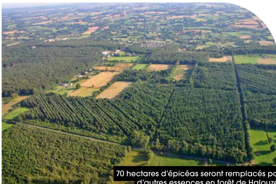
70 hectares d'épicéas seront remplacés par d'autres essences en forêt de Halouze.

« Trois enjeux ont guidé ce plan : l'aspect environnemental, l'exploitation du bois et l'accueil du public » explique Louis Bontemps, chargé de projet d'aménagement et sylviculture à l'ONF. Les choix de gestion de la forêt ont été guidés par le réchauffement climatique. Les épicéas ne seront plus adaptés au futur climat. Les agents forestiers ont décidé de les remplacer par du feuillus. 70 hectares d'épicéas