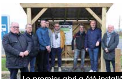
Le premier abri a été installé à Caligny.

Afin d'améliorer le confort et la sécurité des voyageurs, Flers Agglo a commandé la fabrication de dix abris voyageurs en bois pour un montant de 23 100 € toutes taxes comprises. Flers Agglo a souhaité faire travailler une entreprise du territoire qui accompagne l'insertion professionnelle de personnes en situation de handicap, à savoir l'ESAT Les Ateliers du Bocage (association Ornéode). La structure fabrique des abris de grande qualité.