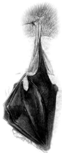
Le Grand Rhinolophe