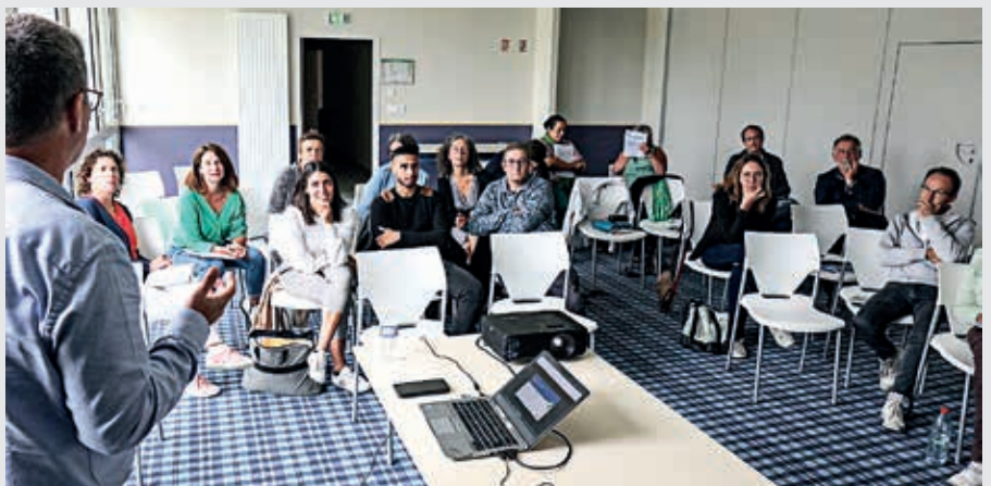
La journée a réuni des professionnels de l'action sociale au contact des familles.

Cette journée a réuni des représentants du Centre communal d'action sociale de la Ville de Flers, à l'initiative de la démarche, du Conseil départemental de l'Orne, de la Mission locale, de la Régie des quartiers et de Média'dom ainsi que des élus.