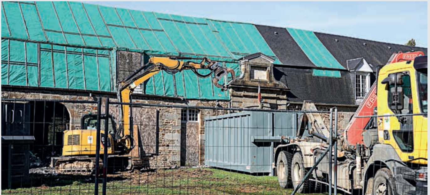
Au lendemain de l'incendie, la mairie avait été bâchée et mise en sécurité afin d'éviter toute dégradation supplémentaire.

Les premiers travaux de la reconstruction de la mairie incendiée en novembre 2019 ont démarré en octobre. Fin 2022, la Ville lancera une consultation pour un concours d'architectes. Le chantier de la nouvelle mairie devrait démarrer fin 2023.