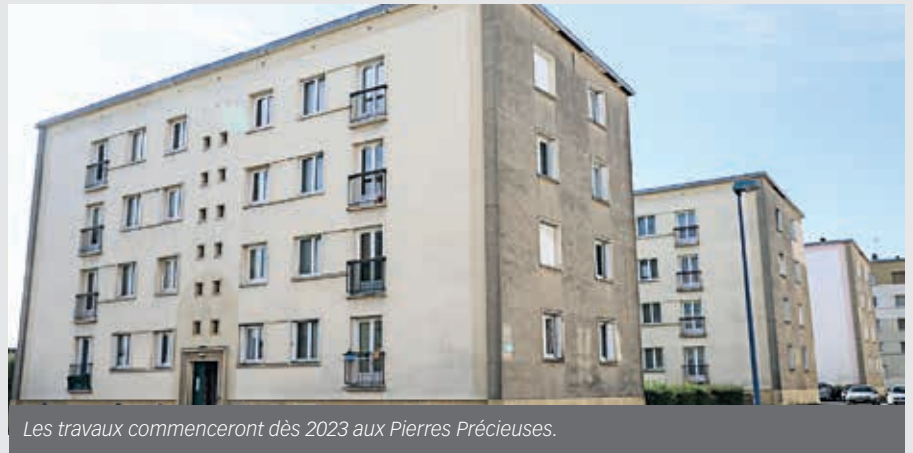
Les travaux commenceront dès 2023 aux Pierres Précieuses.

Les six bâtiments des Pierres Précieuses vont être rénovés. « L'objectif est d'embellir et d'améliorer thermiquement ces bâtiments », résume Logissia qui est allé à la rencontre des locataires pour leur présenter le programme des travaux. Les façades seront refaites et isolées par l'extérieur et les fenêtres changées. Les toitures seront remplacées. Une nouveauté : tous les appartements seront dotés de balcon de près de 4 m 2 . « Il y a très peu d'opération de ce type dans l'Orne », précise Christophe Peltier, directeur de la gestion locative de Logissia dans l'Orne. Les halls seront agrandis avec la construction d'une avancée. Des travaux sont également prévus dans les cages d'escalier.