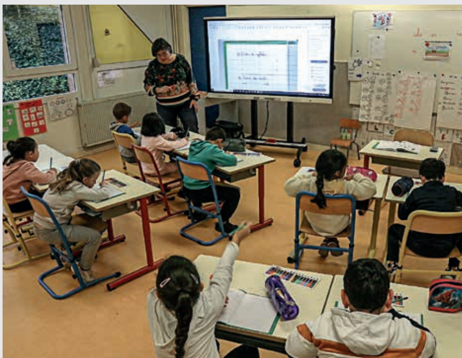
835 élèves sont scolarisés dans les écoles publiques de Flers.

L'élu a aussi évoqué le prix de la cantine qui a légèrement augmenté pour les familles. Il coûte désormais 3,15 € pour faire face à l'augmentation de 10 % des produits alimentaires. Les familles les plus modestes peuvent bénéficier d'une prise en charge. « Le coût d'un enfant lors du temps du midi, entre l'encadrement et le repas, coûte 15 € à la Ville », a remis en perspective le maire.