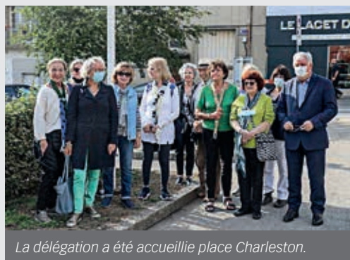
La délégation a été accueillie place Charleston.

Une dizaine d'Américains de Charleston, ville jumelle de Flers, était en visite dans le bocage, en septembre.