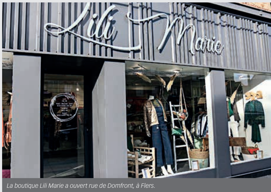
La boutique Lili Marie a ouvert rue de Domfront, à Flers.