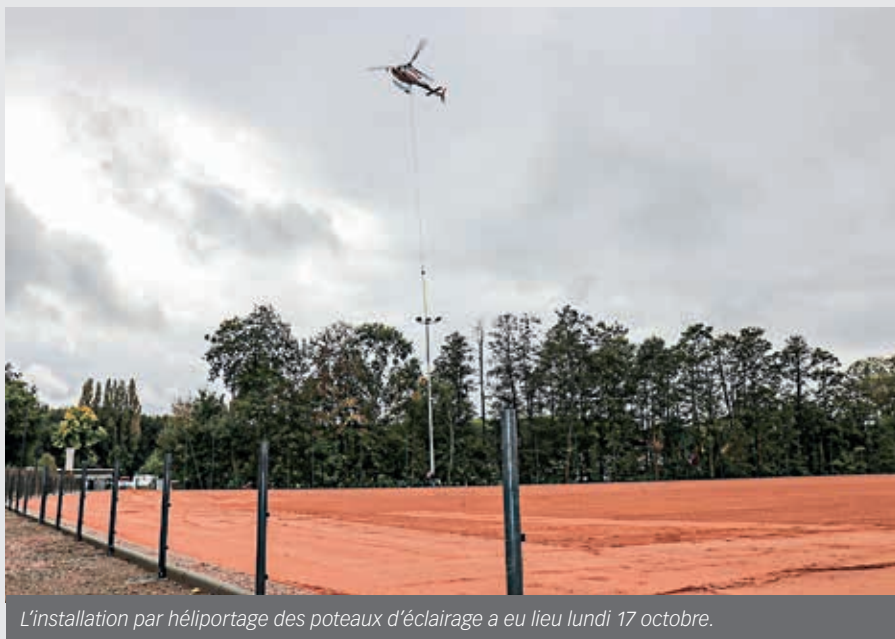
L'installation par hélicoptage des poteaux d'éclairage a eu lieu lundi 17 octobre.

Le terrain sera équipé d'une main courante, d'une clôture pare-ballon, ainsi que de tous les équipements sportifs nécessaires à la pratique sportive. Les tribunes de 250 places vont être remises aux normes, au