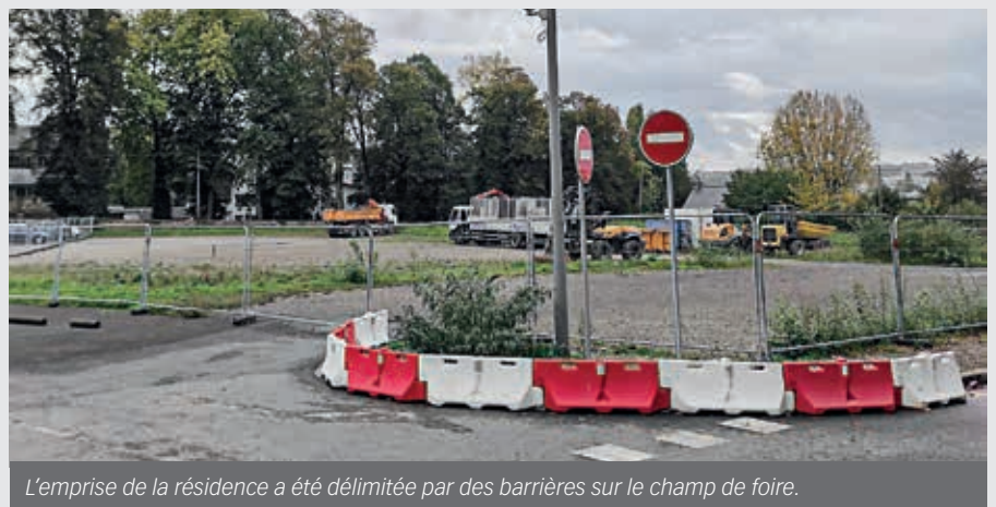
L'emprise de la résidence a été délimitée par des barrières sur le champ de foire.

L'établissement non-médicalisé compterait 110 logements du T1 au T3. Accessible aux seniors autonomes, il sera doté de plusieurs services, notamment d'un espace bien-être, d'un spa, d'une piscine ou encore d'un restaurant, sans oublier les animations. Des places de parking sont prévues en sous-sol. Chaque logement comptera une cuisine équipée, une salle de