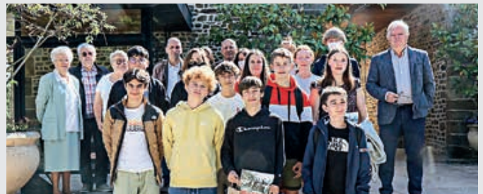
Les collégiens ont été reçus par la Ville de Flers.

La Ville de Flers a mis à l'honneur les collégiens lauréats du concours national de la Résistance et de la Déportation.