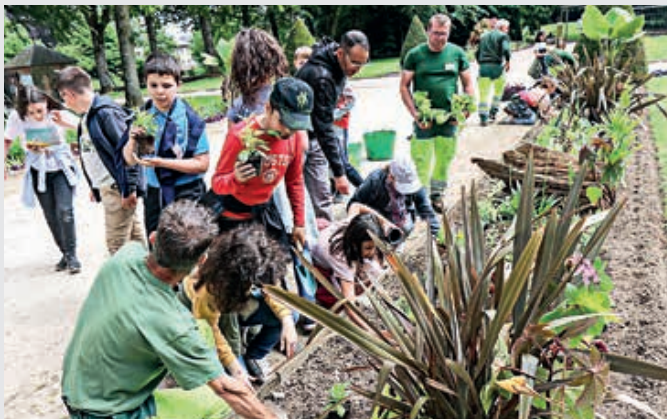
Le service des Espaces verts de la Ville avec les élèves.

Les CM2 de l'école publique Roland, à Flers, ont assisté à l'équipe des Espaces verts de la Ville.