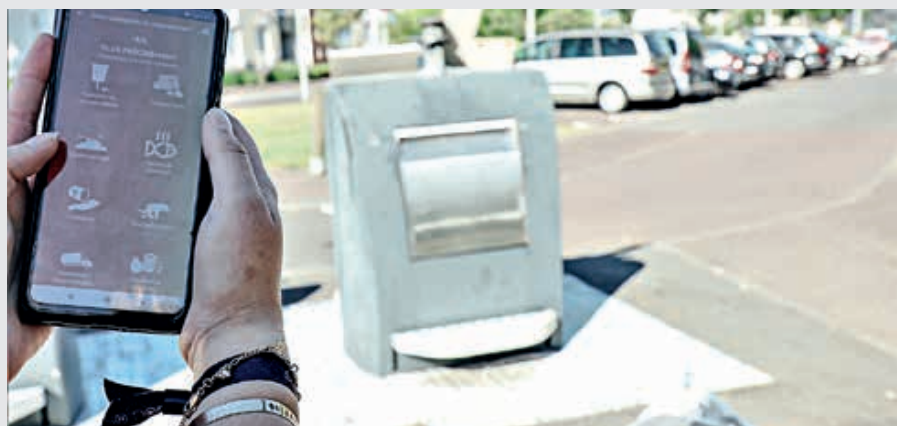
Plus de 1 000 signalements ont été enregistrés sur l'application TellMyCity.

Depuis juin 2021, date de lancement de l'application, plus de 1 000 signalements ont été