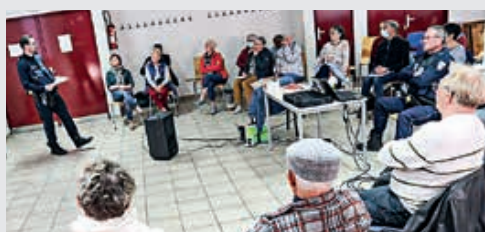
La Police Municipale et le CCAS ont organisé une réunion d'information sur les démarchages et cambriolages au Forum de Flers.

Quelques grands principes ont été énoncés comme veillez à protéger et sécuriser votre