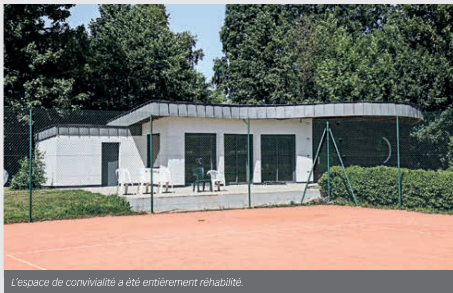
L'espace de convivialité a été entièrement réhabilité.

Alors que le coût de cette réhabilitation s'élève à 147 206 € TTC, 27 962 € de subventions ont été mobilisées (Certificat d'économies