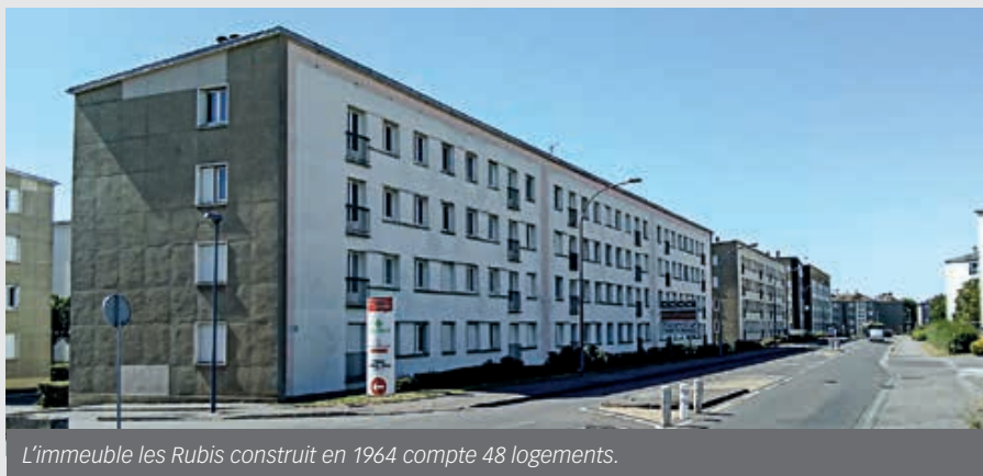
L'immeuble les Rubis construit en 1964 compte 48 logements.

Les premières interventions sur les immeubles vont commencer en septembre avec une première phase de curage. Le désamiantage est prévu en octobre. Une seconde phase de curage sera nécessaire avant la démolition qui pourrait intervenir dès le mois de décembre.