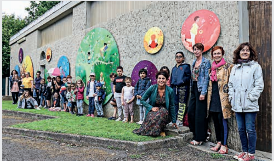
La fresque a été inaugurée lundi 27 juin.

Le résultat est très réussi ! « La façade n'était pas très belle. L'idée était de montrer