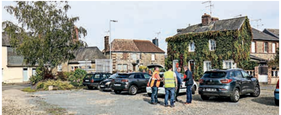
Les travaux d'aménagement du parking devraient être finis avant la fin de l'année.

11 places de stationnement seront matérialisées. Les voitures se gareront en épi. « Le