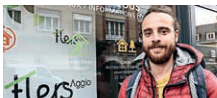
Les conseillers Faire accueillent le public les 2 e et 4 e mercredis du mois, à Flers.

En plus des aides nationales telles que Ma PrimeRénov' ou les Certificats d'Économie