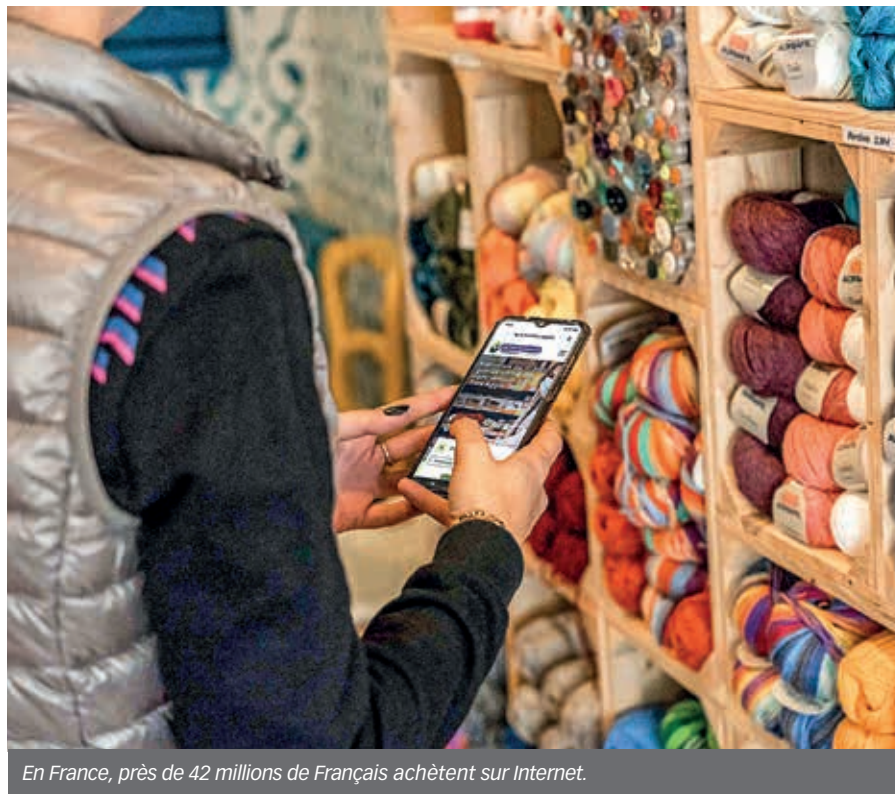
En France, près de 42 millions de Français achètent sur Internet.

En France, près de 42 millions de Français achètent sur Internet. Ce chiffre a bondi de 1,5 million entre 2019 et 2020, selon la Fevad, la Fédération du e-commerce et de la vente à distance. Parmi eux, 27,5 % ont acheté dans des commerces près de chez eux. Cependant, d'après le baromètre Fevad/Médiamétrie, 68 % des cyberacheteurs considèrent que les commerces de proximité devraient proposer la possibilité de commander sur Internet. Autre donnée intéressante : selon une étude