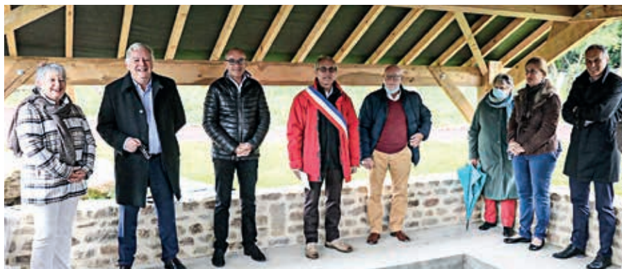
Les élus étaient réunis samedi 2 octobre pour inaugurer le réaménagement du bourg de La Lande-Saint-Siméon.

La route a été entièrement refaite dans le bourg, où la vitesse est désormais limitée à 30 km/h, et des cheminements pour les piétons ont été créés, accessibles aux personnes à mobilité réduite. À cela s'ajoutent la pose de coussins berlinois pour limiter la vitesse