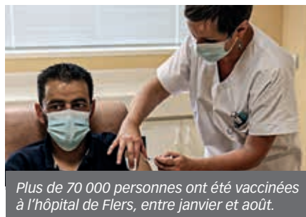
Plus de 70 000 personnes ont été vaccinées à l'hôpital de Flers, entre janvier et août.