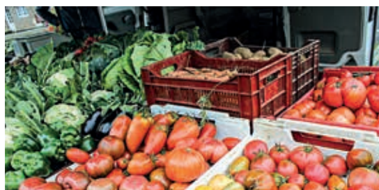
Du champ à l'assiette, soyons tous acteurs de notre alimentation.

Le PAT, c'est donc un projet collectif qui doit bénéficier à tous les habitants du territoire, en commençant par les élèves. Car en plus de sa dimension économique, il s'appuie sur l'éducation à une alimentation de qualité, pari sur l'avenir pour des citoyens en bonne santé, conscients et responsables de leur consommation alimentaire.