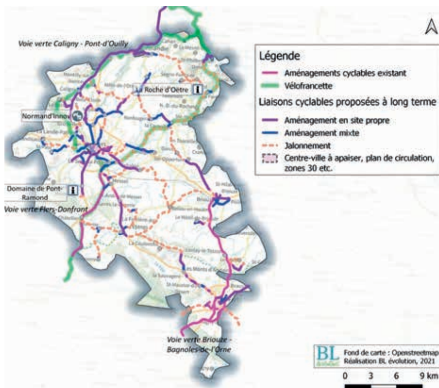
Le projet de schéma cyclable de Flers Agglo à l'horizon 2035.

La dernière phase de l'étude va débiter au dernier trimestre 2021 . Elle a pour objectif de chiffrer les aménagements cyclables, d'étudier la maîtrise d'ouvrage des travaux (évolution des compétences ou accompagnement au financement), de lister les services « vélo » à développer sur le territoire de Flers Agglo.