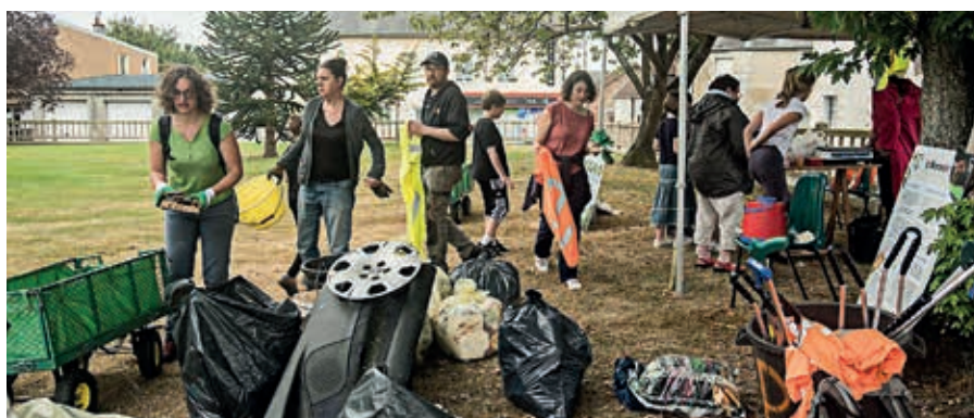
La totalité des déchets ramassés a été pesée puis apportée à la déchetterie de La Carneille.

Flers Agglo a soutenu l'évènement dans sa communication et sa logistique (récupération et évacuation des déchets collectés). Deux agents de Flers Agglo ont prêté main-forte aux bénévoles et mis à disposition paires de