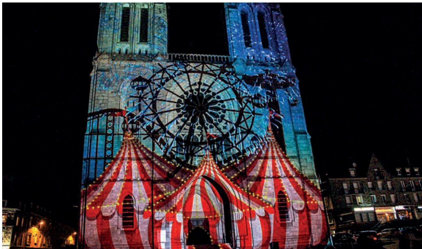
Samedi 4 décembre, les mappings de 2017 à 2020 seront rediffusés sur la façade de l'église Saint-Germain, à Flers.