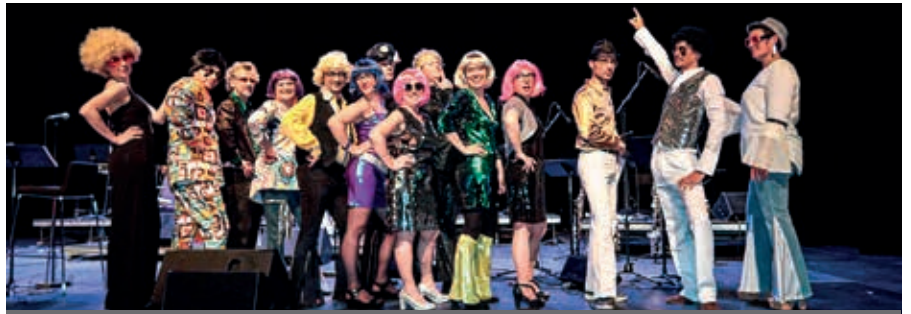
En 2019, les professeurs du conservatoire de musique de Flers Agglo avait détonné avec leur concert disco!

Chaque année, le conservatoire de musique de Flers Agglo organise sa saison culturelle. Concerts, spectacles, stages et conférences sont proposés au grand public. Les concerts ont très souvent lieu à Flers, au Forum, au Centre Madeleine-Louaintier ou au Pôle culturel Jean-Chaudeurge.