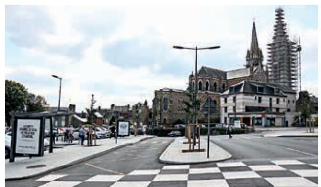
La place Neustadt, à La Ferté-Macé, a été réaménagée pour plus de sécurité.

Les travaux définitifs ont été réalisés d'avril à juin 2020. L'esthétique de la place située en