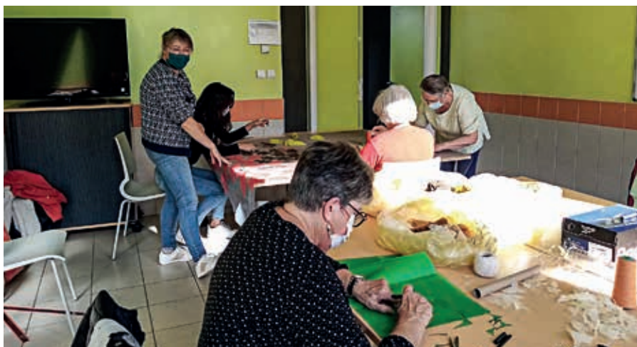
Les ateliers, dans le cadre du projet Vive l'automne, ont lieu tous les mardis de 14 heures à 16 heures.

Nuages de couleurs, feuilles multicolores... Les créations seront installées au fur et à mesure sur l'esplanade de la maison d'activités. Les habitants pourront laisser parler leur imagination, faire évoluer le projet selon