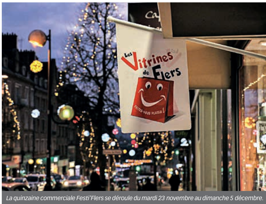
La quinzaine commerciale Festi'Flers se déroule du mardi 23 novembre au dimanche 5 décembre.

Les commerçants des Vitrites de Flers renouvellent leur traditionnelle quinzaine commerciale Festi'Flers, du mardi 23 novembre au dimanche 5 décembre. Une voiture est notamment à gagner.