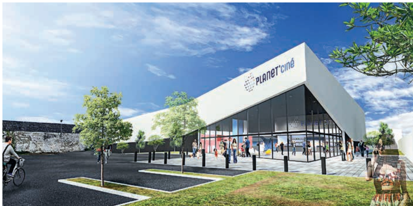
Voici à quoi devrait ressembler le futur cinéma, place du 14-Juillet, à Flers.