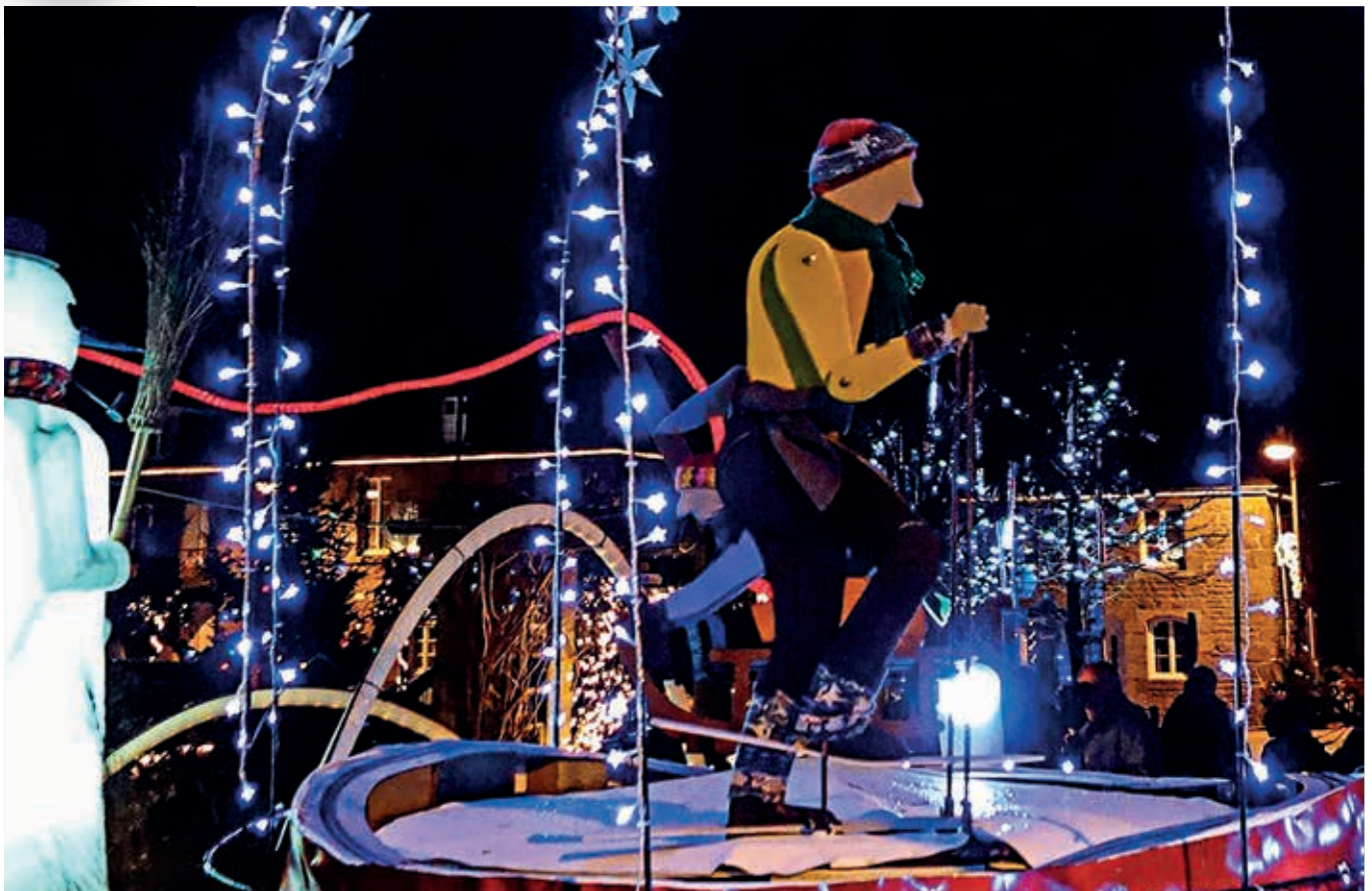
Les villages vont s'illuminer pour les fêtes comme ici, à La Sauvagère.