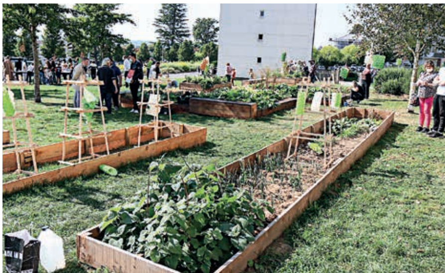
Les jardins partagés du quartier Saint-Sauveur sont situés rue Joseph-Morin, à Flers.

Les habitants, du quartier et d'ailleurs, y cultivent des légumes ou y font pousser des plantes et des fleurs dans les différents carrés potagers. « Nous avons le projet de créer de nouveaux îlots avec des plantes médicinales, des fleurs comestibles et des