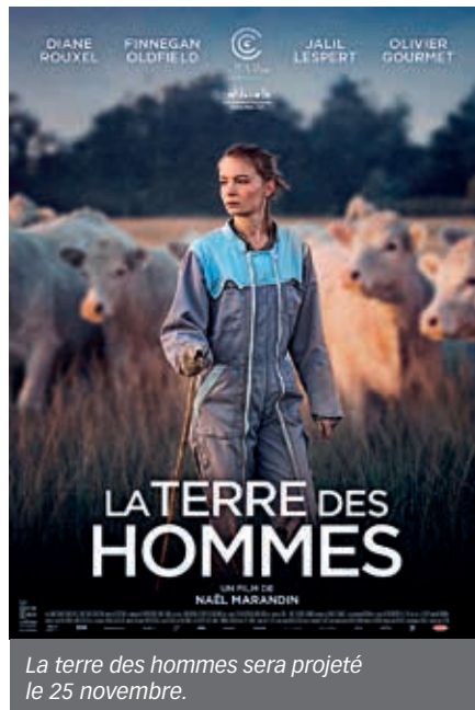
La terre des hommes sera projeté le 25 novembre.

D'infos : + 02 33 38 29 02 - www.cineferte.fr