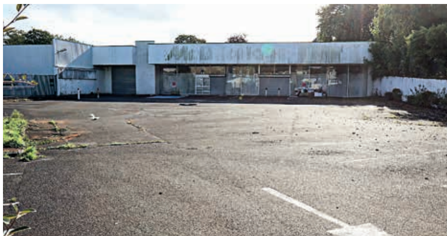
Le bâtiment est vacant depuis décembre 2017.

« La Ville de Flers prendra sa part », a assuré Yves Goasdoué. La partie de la rue de Domfront à proximité du site sera rénovée ainsi que la place du 14-Juillet.