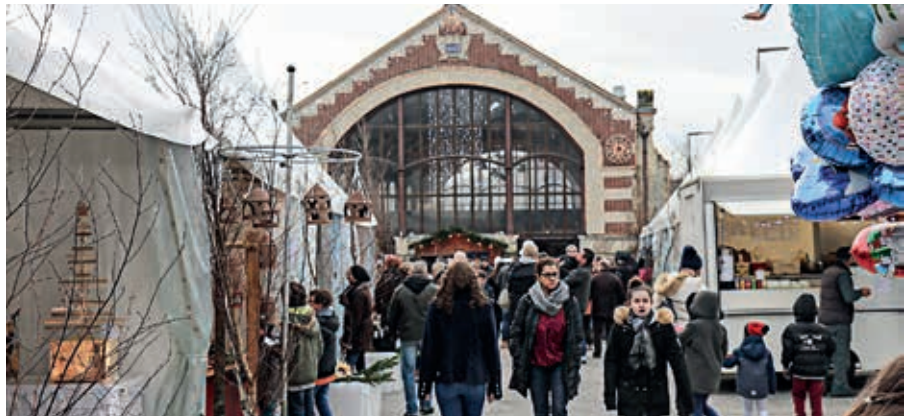
Les marchés de Noël sont l'occasion de partager des moments chaleureux, en dégustant une crêpe ou un chocolat chaud.

Partagez un moment convivial le samedi de