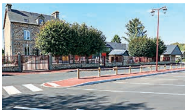
Un parking a notamment été aménagé devant l'école de La Coulonche.

L'ensemble des travaux, accompagnés par Flers Agglo, ont coûté plus de 582 000 € hors taxes. La commune a bénéficié du fonds de concours de la collectivité qui s'élève à 64 200 €