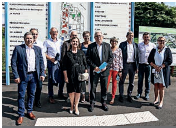
La zone industrielle Beaugard, à La Ferté-Macé, a été inaugurée jeudi 16 septembre.

Le montant total des travaux s'élève à 457 000 € hors taxes. L'État a apporté 220 000 €, au titre de la Dotation de soutien à l'investissement