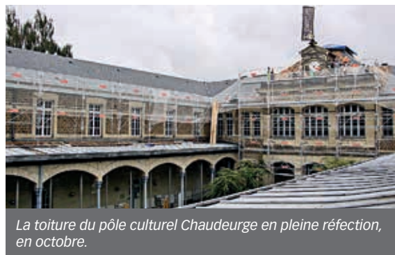
La toiture du pôle culturel Chaudeurge en pleine réflexion, en octobre.

La seconde tranche des travaux, prévue au printemps 2022 et qui devrait durer six mois, consistera à rénover les toitures ardoise des bureaux du pôle culturel (382 m 2 ), remplacer les toitures en fibrociment par du zinc de la médiathèque et de la vidéothèque