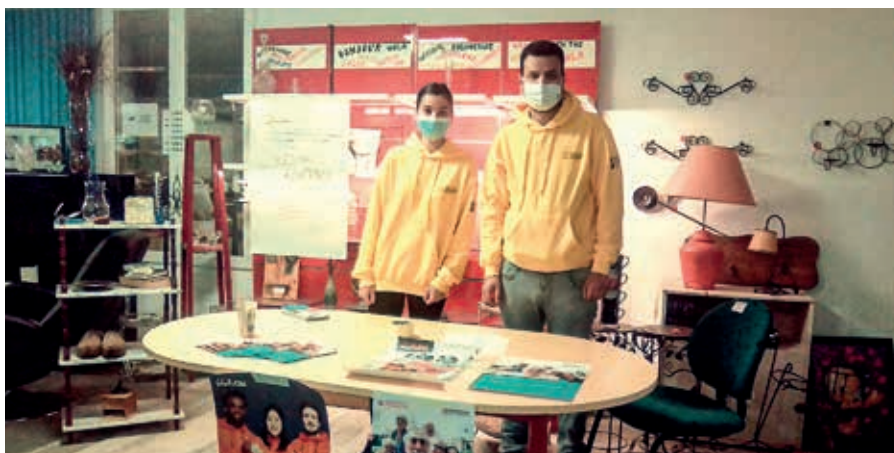
L'animation du Réseau de confiance est confiée à des jeunes en service civique qui se sont engagés dans une mission d'intérêt général.

Pour s'informer sur ces différentes actions et