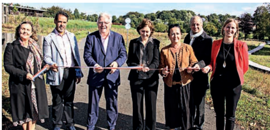
La vallée de La Fouquerie a été inaugurée le 28 septembre.

Le cheminement doux de près d'un kilomètre