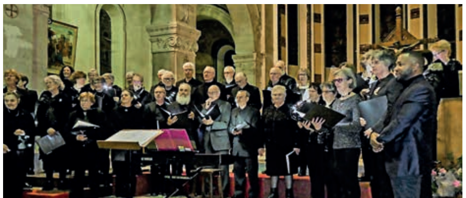
En 2018, la Lyre a fêté son 40 e anniversaire au Forum de Flers avec un programme construit autour de la Cantate de la paix.

La répétition hebdomadaire a lieu le vendredi soir à Flers (1, allée Claude-Chappe dans la