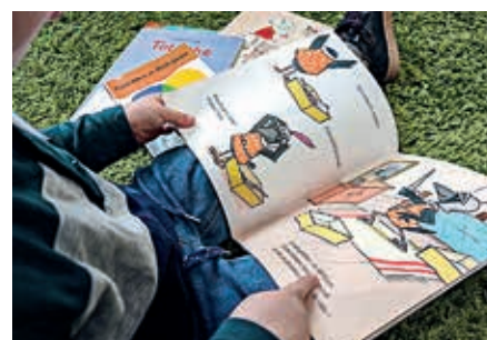
Douze classes de la grande section au CE1 participent au projet.

Les parents des élèves seront indispensables au projet, car l'apprentissage de la lecture se fait à l'école mais se cultive et se partage à la maison. Par ce biais, les médiathèques de Flers Agglo sèment pour l'avenir et espèrent retrouver très vite les familles pour leurs loisirs. Pour rappel, l'emprunt de documents jeunesse