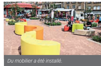
Du mobilier a été installé.

Pour contribuer à l'animation du centre-ville, la Ville de Flers a souhaité installer un espace de convivialité, durant l'été. Il restera jusqu'au dimanche 3 octobre, tout comme le manège et la pêche aux canards.