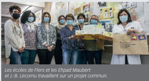
Les écoles de Flers et les Ehpad Maubert et J.-B. Lecornu travaillent sur un projet commun.

Les relations se feront, dans un premier temps, à distance mais tous espèrent que des rencontres puissent être organisées à l'avenir.