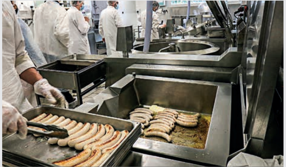
Dans les cuisines du Gip, environ 2 200 repas sont confectionnés chaque jour.

Dans les cuisines, il y a très peu de produits