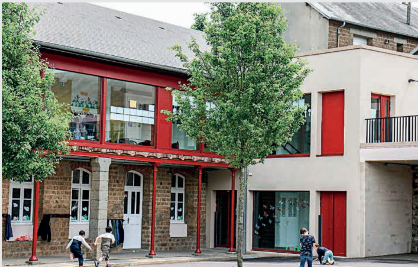
Les élèves font leur rentrée dans une école entièrement rénovée.

Les travaux de rénovation de l'école Sévigné - Paul-Bert, dans le centre-ville de Flers, se sont achevés cet été avec la réfection de deux cours. Le chantier aura duré 3 ans pour un montant de près de 2 millions d'euros.