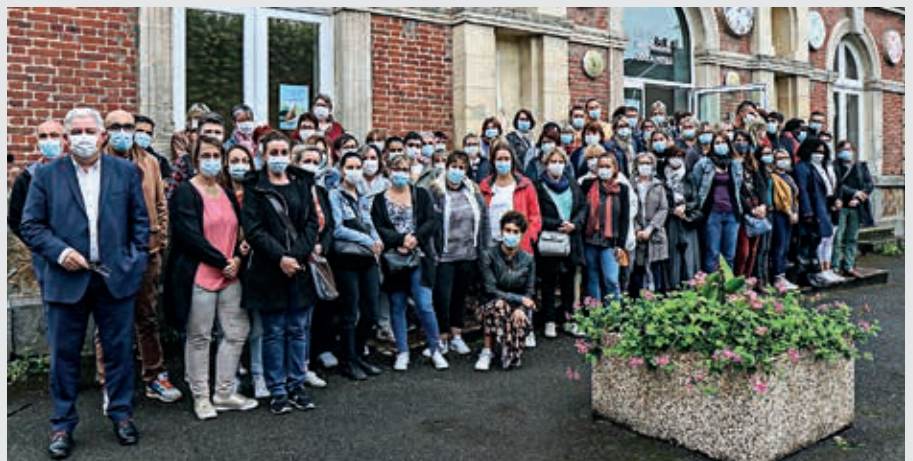
Les agents du service scolaire-périscolaire, en juin 2021.

Les agents organisent des animations à partir d'un fil rouge défini par les équipes et participent à celles en lien avec les projets de chaque école. Sans oublier les animations