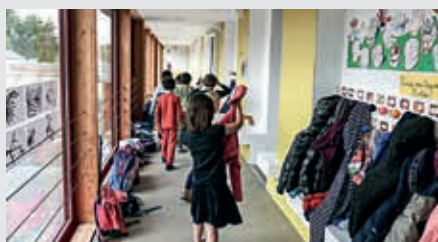
Deux classes ont réinvesti les lieux en mars 2021.

Les élèves de maternelle et les plus petits de l'élémentaire de l'école Sévigné - Paul-Bert, soit environ 160 enfants, font leur rentrée scolaire dans un établissement entièrement rénové. Les travaux avaient commencé en septembre 2018 et ont concerné les bâtiments situés le long de la rue des Écoles.