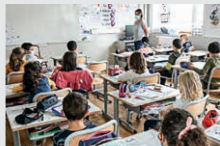
Les salles ont été refaites et le mobilier changé.

Les élèves vont également bénéficier d'une salle mutualisée d'arts visuels et d'activités