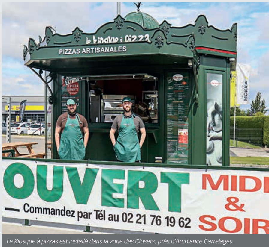
Le Kiosque à pizzas est installé dans la zone des Closets, près d'Ambiance Carrelages.

Pour contribuer à l'animation du centre-ville, la Ville de Flers a souhaité installer un espace de convivialité, durant l'été. Il restera jusqu'au dimanche 3 octobre, tout comme le manège et la pêche aux canards.