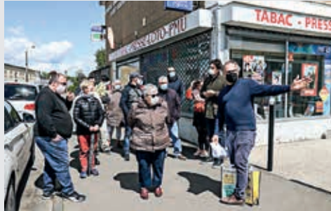
Les habitants ont participé à des balades dans le quartier, en mai, pour exprimer leurs souhaits en termes d'aménagements.

Des balades urbaines ont été organisées, en mai, par groupe de six personnes. Elles ont permis de réunir une cinquantaine d'habitants que ce soit des familles ou des retraités, nouveaux arrivants ou « anciens » du quartier.