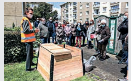
Des agents du Sirtom ont expliqué comment utiliser le composteur.

Le Sirtom Flers-Condé, le syndicat intercommunal de ramassage et de traitement des ordures ménagères, a installé quatre nouveaux composteurs dans le quartier Saint-Michel, à la demande du conseil citoyen. Les habitants peuvent déposer les déchets organiques et réduire le poids de leurs ordures ménagères... Il y en a désormais six dans le quartier avec ceux installés aux jardins partagés. Des habitants ont été désignés pour s'en occuper. Le terreau récupéré pourra servir dans le jardin ou pour des jardinières!