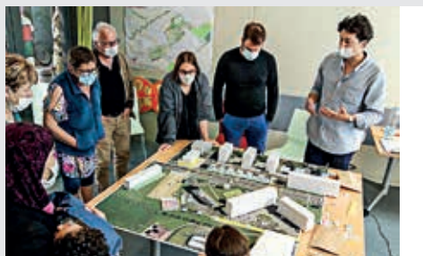
La rénovation du quartier Saint-Michel fait l'objet d'une concertation avec les habitants.

Un deuxième document permet de découvrir des illustrations du projet urbain. Il comporte aussi deux questionnaires à choix multiples pour recueillir leurs avis en particulier sur des aménagements possibles.