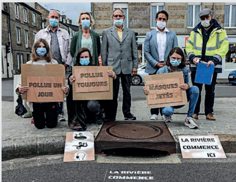
Les élèves de Segpa de Jean-Monnet ont souhaité peindre quelques messages eux-mêmes, notamment place Paulette-Duhalde.

Seize élèves ont inventé les messages, conçu certains dessins d'illustration et réalisé les pochoirs en contreplaqué aux Bains douches