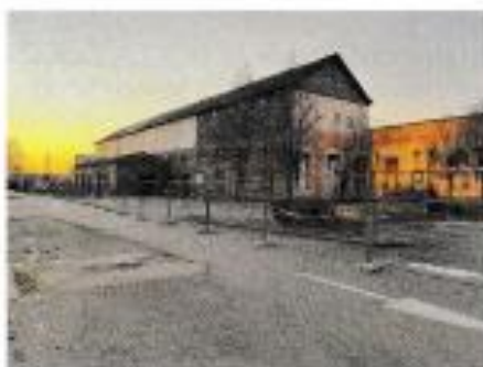
Extrait pièce n° 5

Or, FLERS AGGLO semble avoir déjà anticipé la mise en place de son futur projet, puisque ses services ont placé des barrières, condamnant l'accès au parking, et empêchant donc ma cliente d'accéder à sa propriété ( pièce n° 5 ).