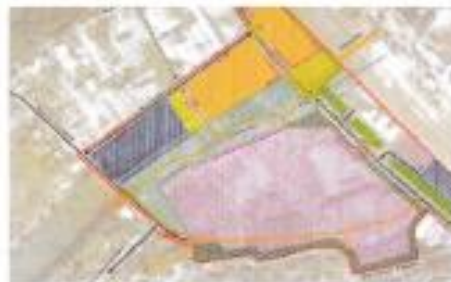
Extrait pièce n° 2

Ma cliente est propriétaire d'une parcelle sise rue DURMEYER à FLERS, et cadastrée section BI n° 139 ( pièce n° 2 ) :