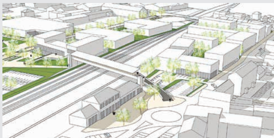
Voici à quoi pourrait ressembler le nouveau quartier du Plancaïon.

Sur ce site, Flers Agglo envisage de réaménager la rue Jacques-Durrmeyer. Une voie cyclable serait créée ainsi que des carrefours giratoires pour sécuriser les intersections. Des arbres pourraient être plantés le long