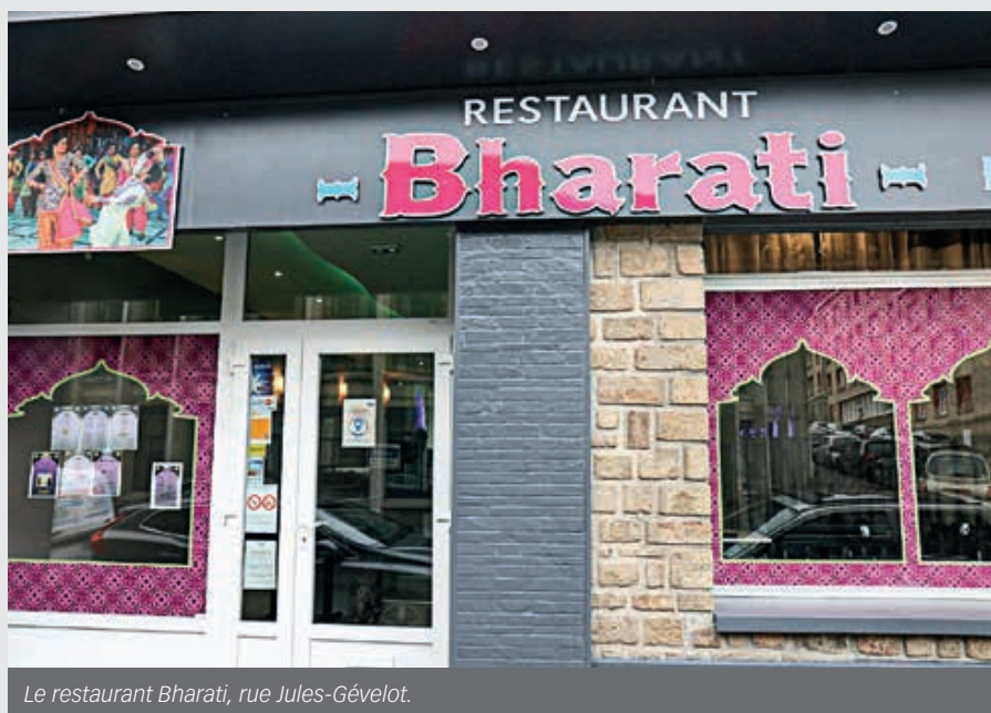
Le restaurant Bharati, rue Jules-Gévelot.