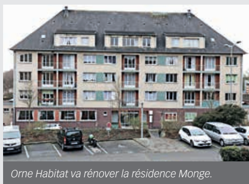
Orne Habitat va rénover la résidence Monge.

Au fil des années, il s'est avéré nécessaire d'engager un important chantier de rénovation des appartements. Le bailleur social Orne Habitat, labellisé pour gérer ce type de résidence et disposant sur Flers d'une longue expertise de gestion de logements pour seniors avec Constant-Gayet et l'Orsonnière, a confirmé sa volonté d'acquiescer le bien. Son prix a été fixé à 500 000 €. Il s'est