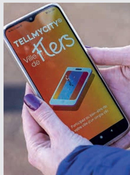
L'application TellMyCity permet de signaler un incident sur le domaine public.

TellMyCity est un nouvel outil citoyen à Flers qui va permettre de simplifier et de fluidifier les échanges entre les habitants et les services de leur ville.