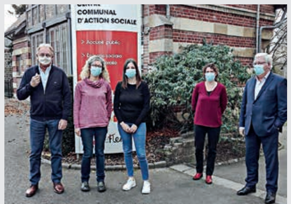
Le CCAS de Flers a reçu le label Point conseil budget en novembre 2020.

Ce nouveau service est ouvert à tous les habitants de Flers.