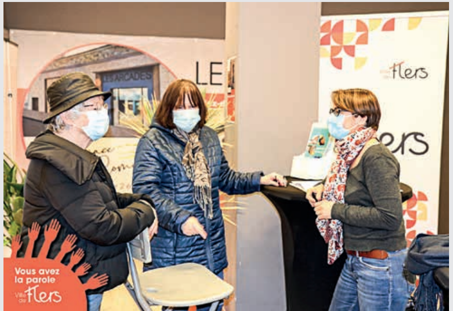
Les permanences d'information ont repris en février.

Ces conseils seront autonomes dans leur fonctionnement. Chacun veillera toutefois à ce que les débats se déroulent dans le respect des valeurs républicaines (liberté, égalité, fraternité, laïcité, neutralité, diversité, parité, respect de la parole de chacun...). Une association composée d'élus et de représentants de chaque conseil coordonnera l'ensemble. L'idée a déjà séduit une vingtaine de personnes