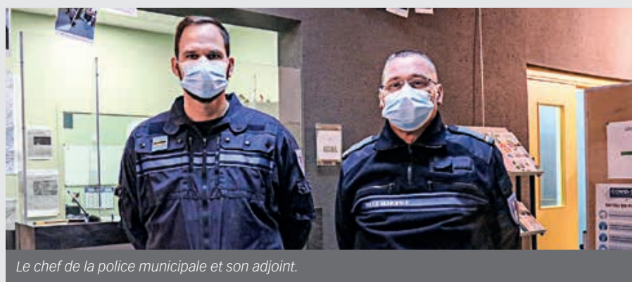
Le chef de la police municipale et son adjoint.

La police municipale tient deux permanences mensuelles, dans les maisons d'activités Émile-Halbout et Saint-Michel, à Flers.