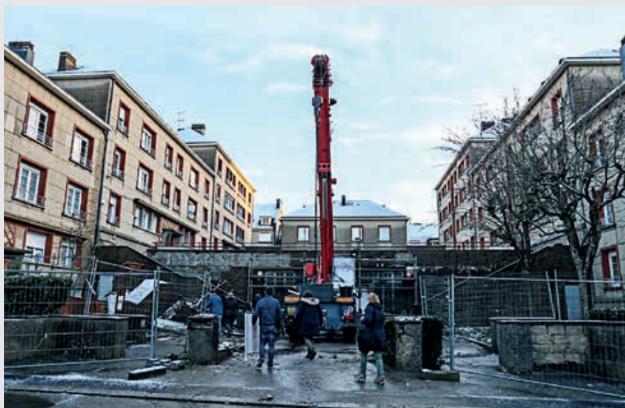
Le montant des travaux de la résidence Saint-Germain, en centre-ville de Flers, est estimé à 458 000 €.

Cette copropriété, qui épouse la pente naturelle du terrain, comprend 41 logements et cinq locaux commerciaux construits autour d'une cour traversante. C'est cette cour, dégradée, qui a notamment besoin d'être remise en état. Un architecte a été missionné par le syndicat des copropriétaires. Les sols et les parements de façade du parking en sous-sol seront refaits avant d'aménager un espace extérieur convivial. Les espaces verts seront également revus et des bancs ajoutés.