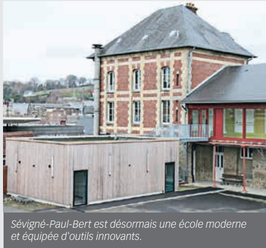
Sévigné-Paul-Bert est désormais une école moderne et équipée d'outils innovants.

Les toilettes ont également été refaites et même déplacées dans la cour pour celles