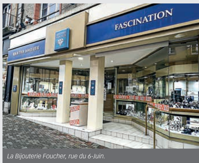
La Bijouterie Foucher, rue du 6-Juin.

La bijouterie Fascination, située 7, rue du 6-Juin, à Flers, a été reprise par la bijouterie Foucher.