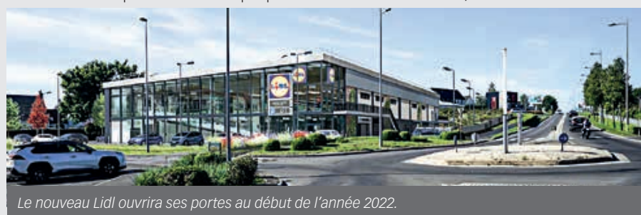
Le nouveau Lidl ouvrira ses portes au début de l'année 2022.

personnel. La surface de vente passera de 820 m 2 à 1415 m 2 et il y aura 131 places de stationnement au lieu de 80 actuellement grâce à l'aménagement d'un parking sous le bâtiment. Le nombre de références proposées restera relativement stable. Une place plus grande sera toutefois faite aux produits non-alimentaires. Durant les travaux, l'activité du Lidl va être temporairement transférée dans un autre lieu, à Flers.