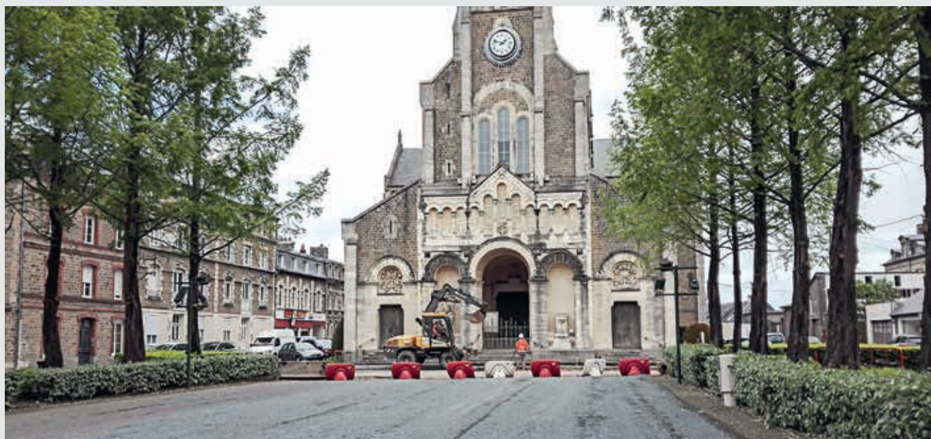
La place Saint-Jean a été refaite en mai pour offrir de meilleures conditions d'utilisation aux piétons et commerçants du marché.

Le vote du budget 2019 de la Ville de Flers a permis de mettre en évidence les capacités financières de la collectivité en matière d'investissement. En effet, sur l'exercice à venir, 6,250 M d'euros seront engagés en dépenses d'investissement. « Un des meilleurs budgets que j'ai eu à présenter », pour le maire Yves Goasdoué.