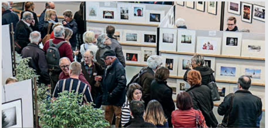
Quatre-vingt-deux associations reçoivent une subvention de la Ville de Flers

ALDEVA Condé-Flers; Élan; Cadet Roussel; Cercle des retrouvailles; Don du sang Flers et sa région; Entraide flérienne; Rêve de bouchons61; UNAFAM; UNPRA; VMEH; Vie libre Flers - Saint-Georges