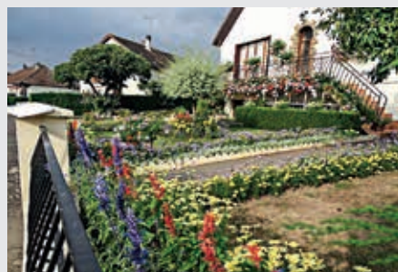
Maison avec jardin visible de la rue.

Inscription jusqu'au vendredi 5 juillet à la mairie service citoyenneté et vie quotidienne (Bulletin d'inscription également disponible au bureau d'information de l'Office de Tourisme à Flers).