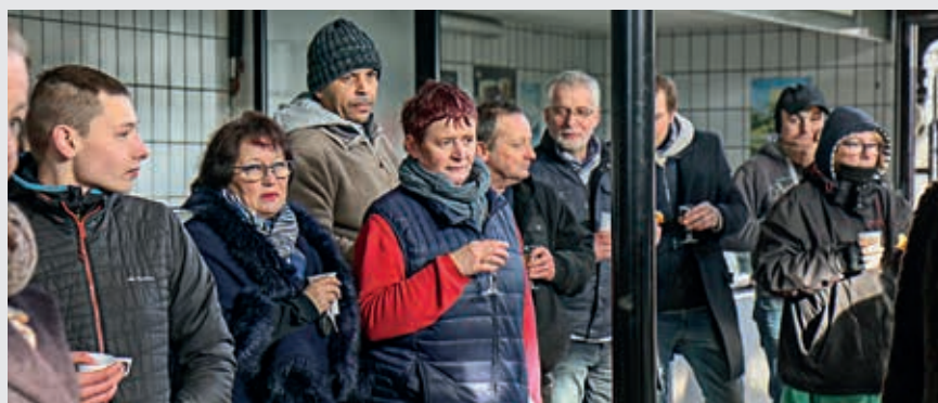
La réception qui sera renouvelée tous les ans a eu lieu sous le marché couvert.

Les commerçants des trois marchés hebdomadaires de Flers ont été conviés en début d'année à une réception sous le marché couvert.