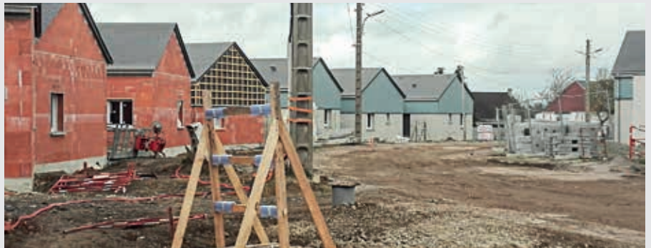
La rue du clos-Morel en plein travaux mi-avril.