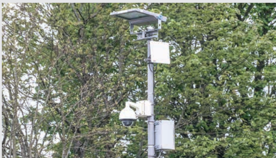
Les premières caméras ont été installées.

Au total, 50 caméras seront connectées. « Grâce à l'étude réalisée, l'extension des réseaux et le raccordement ont été plus simples à mettre en place. Ainsi, le calendrier fixé pourra être respecté » ,