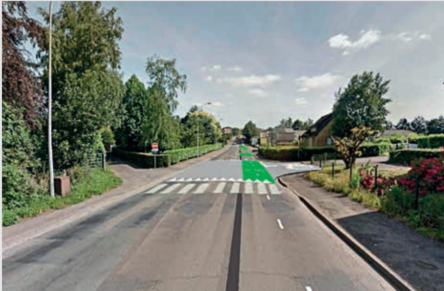
Avenue de Verdun à hauteur de la rue de Surville après travaux: chaussée partagée avec la piste cyclable, et réalisation d'un plateau à hauteur de la rue de Surville (photomontage).

D'ici quelques semaines, l'image que tous les Flériens ont de l'avenue de Verdun appartiendra au passé. C'est une nouvelle avenue que les automobilistes devront apprendre à utiliser et surtout à partager avec les cyclistes.