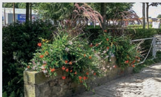
Un exemple de fleurissement d'un parterre en centre-ville.

Avec trois fleurs depuis 2008, Flers figure parmi les collectivités les mieux fleuries du département. Le résultat d'un travail permanent pour rendre la ville colorée, agréable à l'œil, mais aussi à vivre.