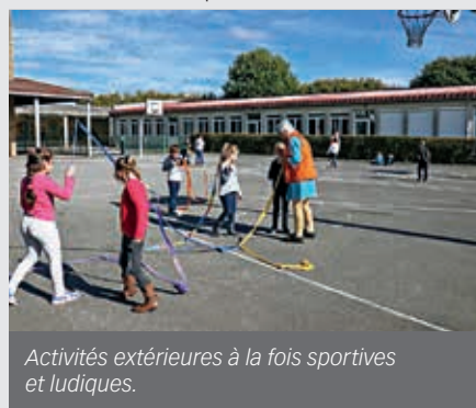
Activités extérieures à la fois sportives et ludiques.

L'école travaillant sur l'axe du cirque, le temps périscolaire a intégré le cirque et le cinéma dans les animations. Le film Chocolat a été visionné en fin de période.