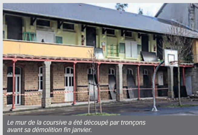
Le mur de la coursive a été découpé par tronçons avant sa démolition fin janvier.

L a rénovation du groupe scolaire Sévigné - Paul-Bert est aujourd'hui entrée dans sa phase de travaux sur les deux écoles. Depuis le début de l'année, les premiers chantiers de démolition ont débuté. Le portail d'entrée de la maternelle Sévigné a été démolé, ainsi que des murs à l'intérieur de certains espaces entre les deux écoles.