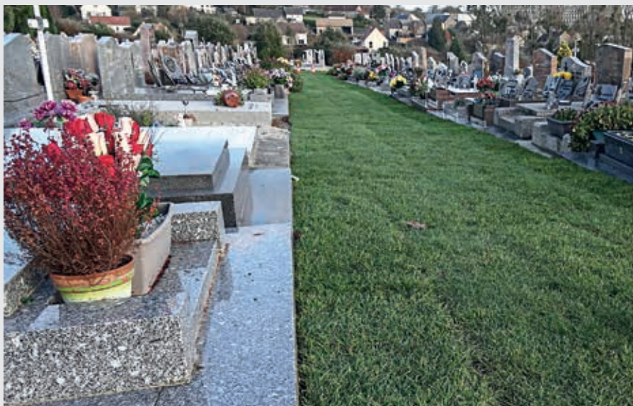
Dans quelques mois, 14 allées du cimetière de Flers seront végétalisées.

Deux allées ont été engazonnées par placage. Les douze restantes seront profilées et engazonnées en avril par ensemencement. Elles remplaceront les allées en gravier dont l'entretien nécessitait l'utilisation de produits chimiques.