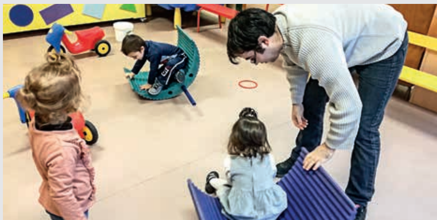
Le lieu passerelle est un espace de transition permettant une séparation progressive parents-enfants vers l'école.

Une Éducatrice de Jeunes Enfants (EJE), anime la passerelle en collaboration avec l'enseignant chargé de la classe des moins de 3 ans. L'accueil dans le lieu passerelle est possible tout au long de l'année scolaire :