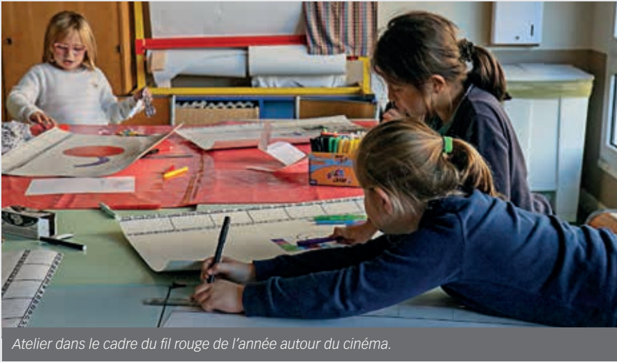
Atelier dans le cadre du fil rouge de l'année autour du cinéma.

Depuis la rentrée de septembre 2018, la semaine de classes a été ramenée à 4 jours.