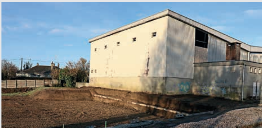
Une bonne nouvelle pour les utilisateurs du gymnase (collégiens, clubs sportifs) accueillis dans d'autres structures depuis près de 3 ans.

Si le terrassement de l'extension est terminé,