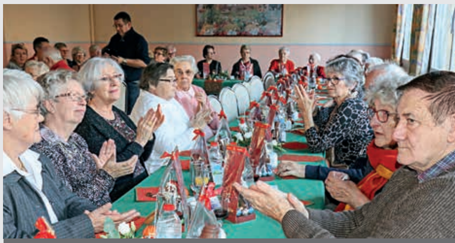
Pour les résidents de Monge, le goûter-spectacle de fin d'année est un moment de retrouvailles à ne pas manquer.

Cette réunion, sur un même événement, des familles suivies par les associations a permis