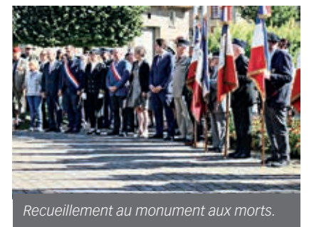
Recueillement au monument aux morts.

Chaque 25 septembre, Flers s'associe à la journée nationale d'hommage aux Harkis et membres des formations supplétives.