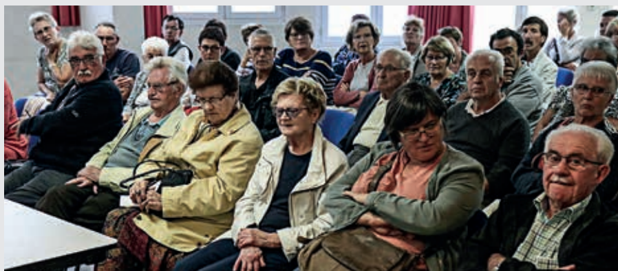
Pour les riverains de la rue d'Athis, la dernière phase de travaux a pris fin en novembre.

Rue de la Bissonnière: un ralentisseur près du squash et un passage piéton (avant la rue Désiré-Pilot) vont être installés (coût 13 000 €).