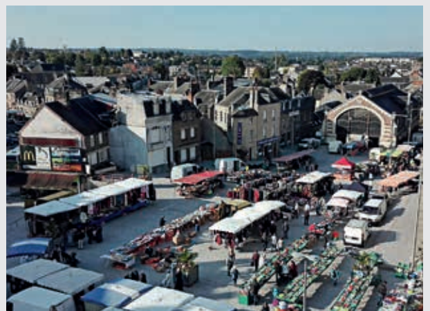
Le marché dans sa nouvelle configuration.

Le prochain chantier concernera la rénovation extérieure de la halle couverte et sa mise en lumière. Il faudra réfléchir, le temps des travaux, à l'implantation des commerçants