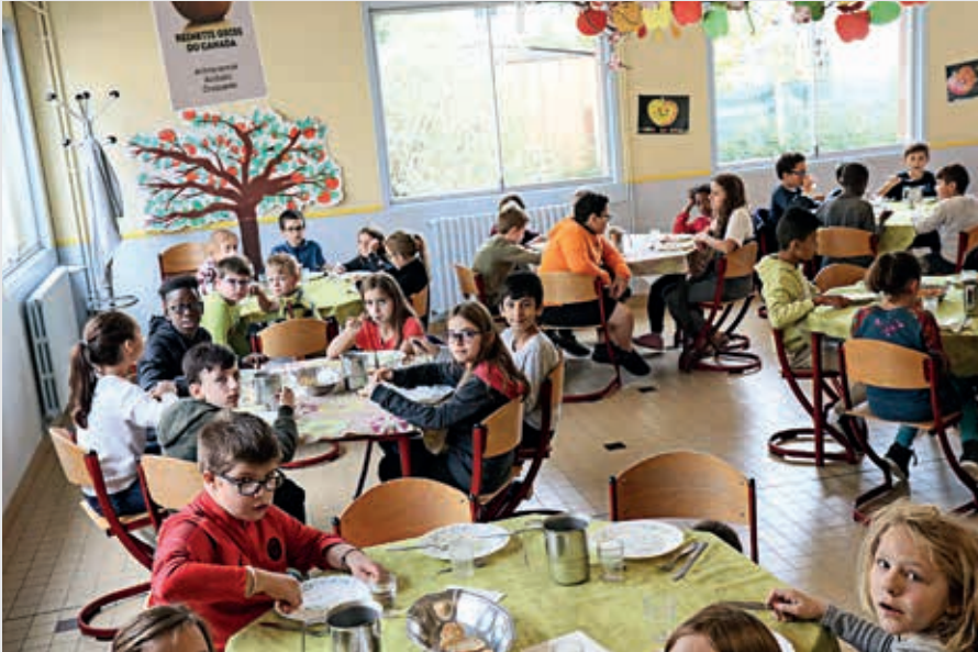
La pomme était présente partout à l'occasion de la semaine du goût.

La rentrée scolaire des écoles publiques de Flers a été marquée par plusieurs nouveautés pédagogiques et une découverte gastronomique.