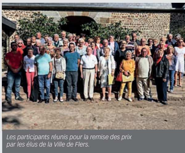
Les participants réunis pour la remise des prix par les élus de la Ville de Flers.

C ette année le jury, deux élus et deux techniciens du service Espaces verts, a dû composer, à l'heure d'établir le palmarès, avec une météo qui n'a pas favorisé le travail des jardiniers.