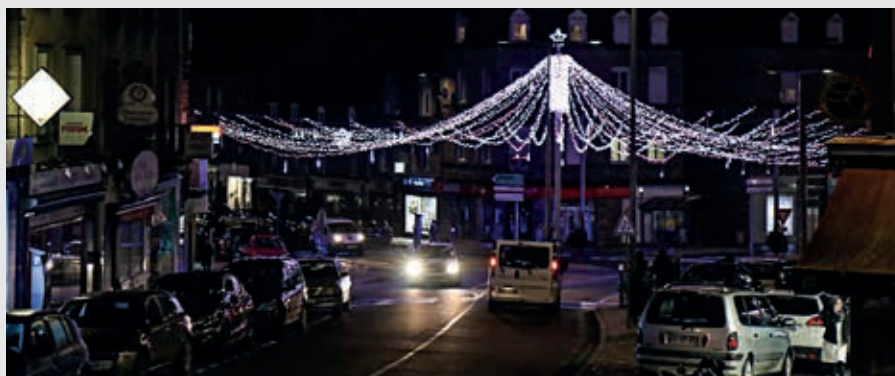
Le chapiteau place Maréchal-Leclerc sera à nouveau installé cette année.

Une première qui sera suivie, pour la seconde année, d'un mapping sur la façade de l'église Saint-Germain avec des surprises !