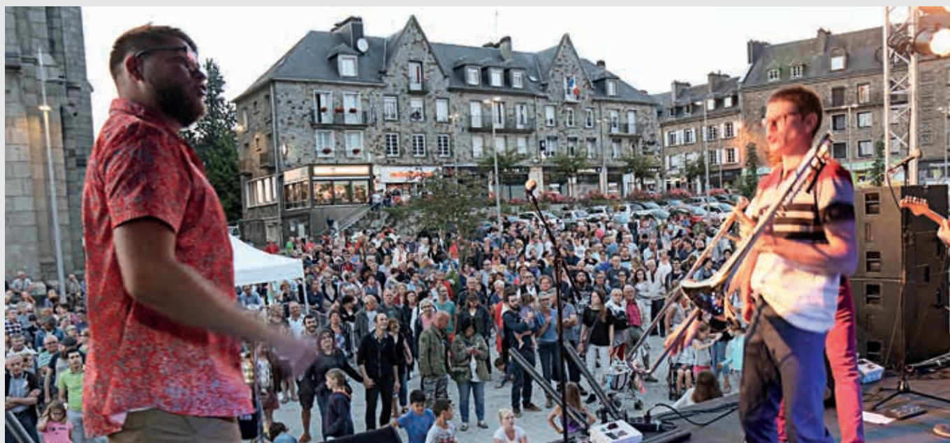
En juillet-août, les concerts du vendredi ont attiré la foule place Saint-Germain.

Engagé depuis 2010, l'aménagement du centre-ville de Flers s'est terminé au cours de l'été 2017. Une étape importante dans la politique de redynamisation et d'attractivité de la ville centre du Bocage, au cœur d'une zone de chalandise de plus de 90 000 habitants.