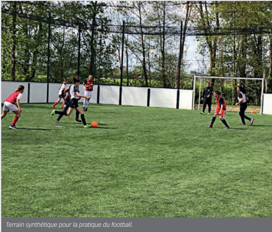
Terrain synthétique pour la pratique du football.

Après les aménagements réalisés au début de cette décennie, le Complexe sportif du Hazé poursuit son évolution. De nouveaux équipements ont été construits au profit des associations et des partenaires de la Ville de Flers.