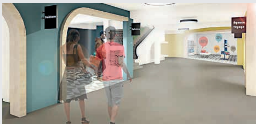
Le bâtiment, occupé par l'enseigne Prisunic, a marqué l'histoire et les habitudes de consommation des Flériens. Il a été loué de 1999 à 2016 à l'enseigne La Halle.

Onze cellules de 30 m 2 à 500 m 2 sont prévues (6 au rez-de-chaussée et 5 à l'étage). Les futurs exploitants bénéficieront du dispositif d'aide