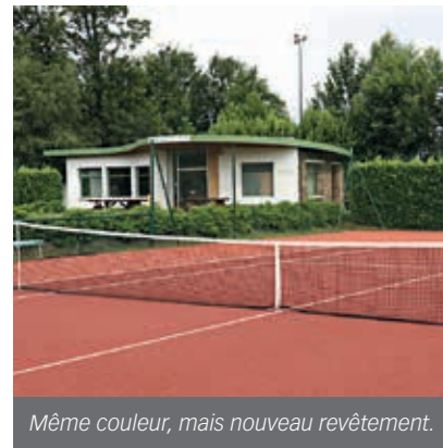
Même couleur, mais nouveau revêtement.

Espace de convivialité : 689 000 € TTC (construction, équipement, démolition du club house, aménagement voirie) ; financement Ville de Flers 479 000 €, Fédération Française de Football (FFF) 40 000 €, Région (CAT) 125 000 €, État (Politique de la Ville) 45 000 €.