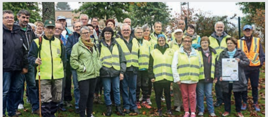
Comme pour les précédentes éditions, la journée randonnée du dimanche 7 octobre ouvrira la Semaine bleue 2018 à Flers.

Lundi 8 octobre 14h, Centre Madeleine-Louaintier : Théâtre « Qu'est-ce qu'on attend pour être vieux » proposée par l'ASEPT (Association Santé Éducation et Prévention sur le Territoire) avec le CCAS de Flers.