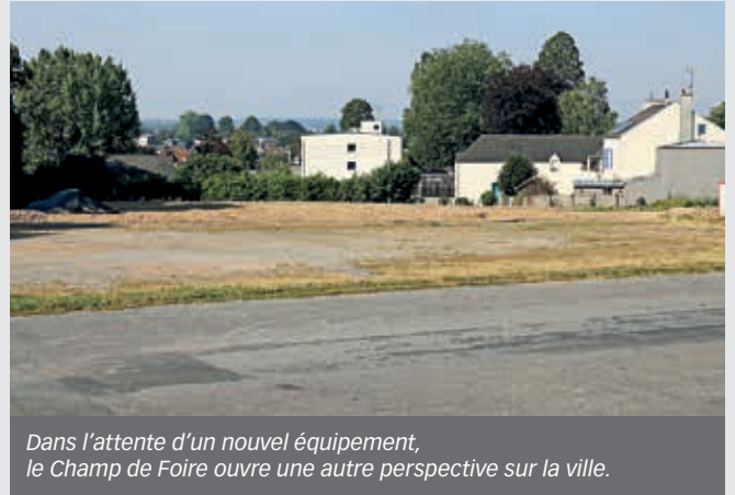
Dans l'attente d'un nouvel équipement, le Champ de Foire ouvre une autre perspective sur la ville.

F in juin, une page de la vie sportive et événementielle de Flers s'est tournée avec la démolition du gymnase du Champ de Foire.