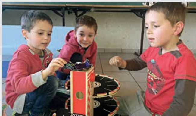
Inscrire ses enfants au centre de loisirs le mercredi sera l'une des options offerte aux parents.

Le retour à la semaine de 4 jours pour les écoles de Flers va s'accompagner de l'ouverture des centres de loisirs de Flers et sa périphérie le mercredi.