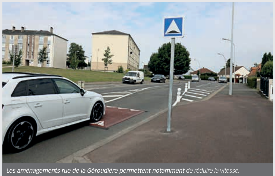
Les aménagements rue de la Géroldière permettent notamment de réduire la vitesse.

Le principal chantier concernera la rue d'Athis du chemin des Tourelles jusqu'à la rue de l'Ermitage. Il s'agira de la 3 e et dernière phase (voirie et trottoirs).