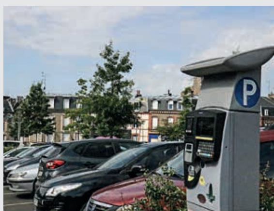
Après les nombreux aménagements apportés, la politique tarifaire du stationnement payant en centre-ville de Flers entrera en vigueur début septembre.

Le tarif (8 € par mois) concerne les résidents des rues et places situées dans le