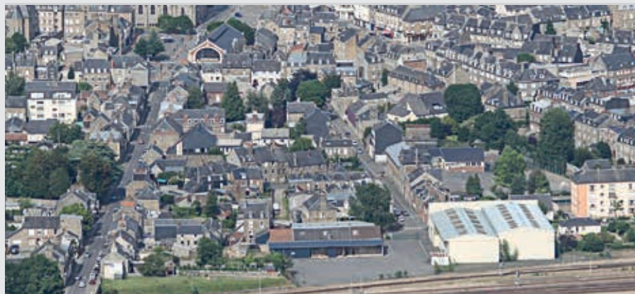
Le centre-ville jusqu'à la gare devrait bénéficier d'importants aménagements.