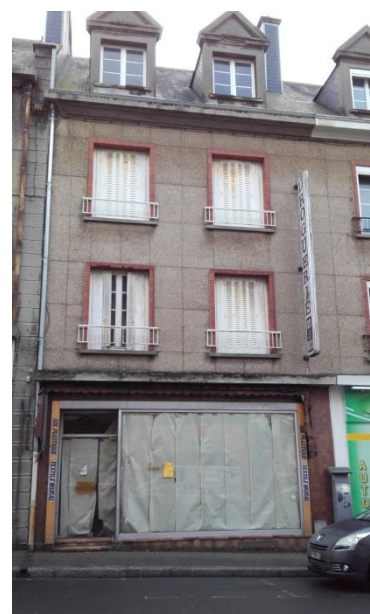
Façade sur rue avant travaux

Loyers maximums applicables T3 de 47 m 2 avec cave : 334 € et 336 € mensuel; T2 de 43 m 2 avec cave : 349 € mensuel.